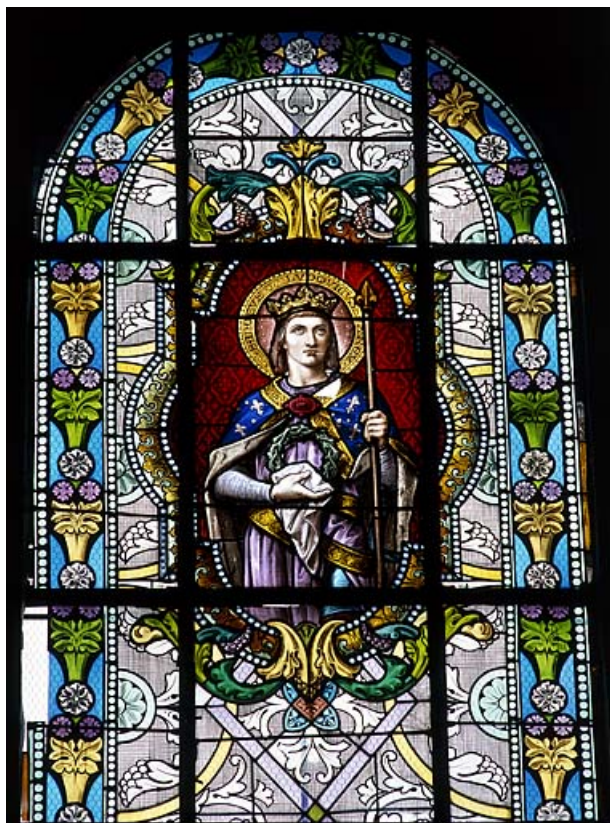
Baie 5 : vue rapprochée.