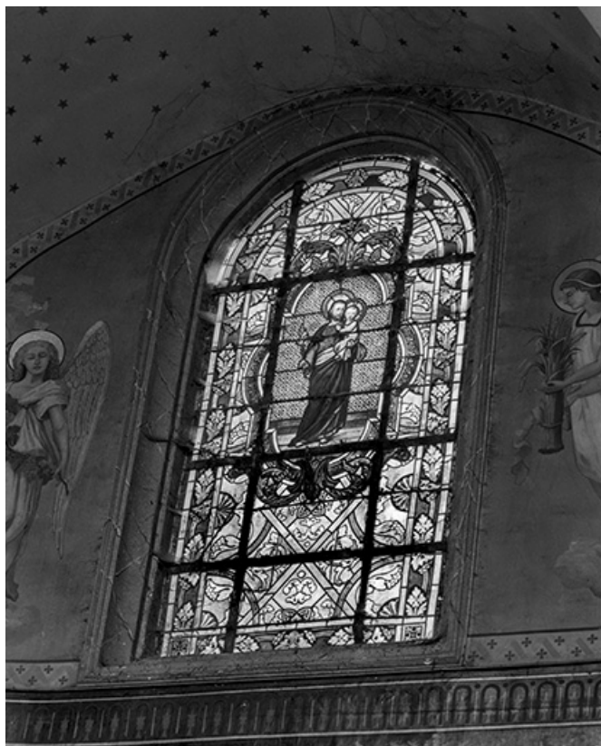
Baie 2 : vue d'ensemble.