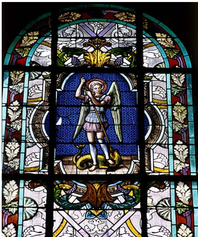
Baie 1 : vue rapprochée.