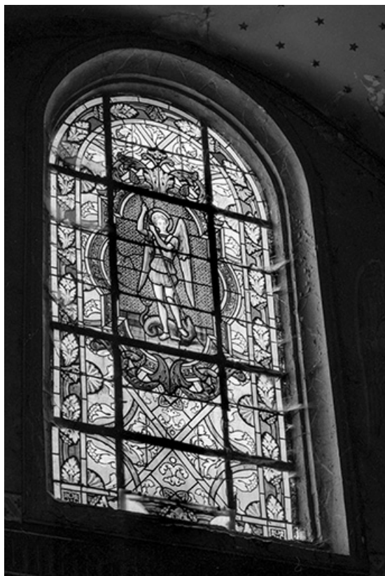
Baie 1 : vue d'ensemble.