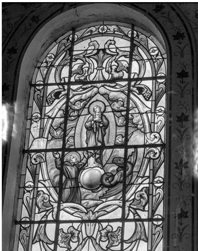
Baie 5 : vue rapprochée.