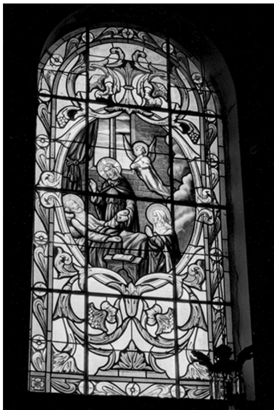
Baie 6 : vue d'ensemble.