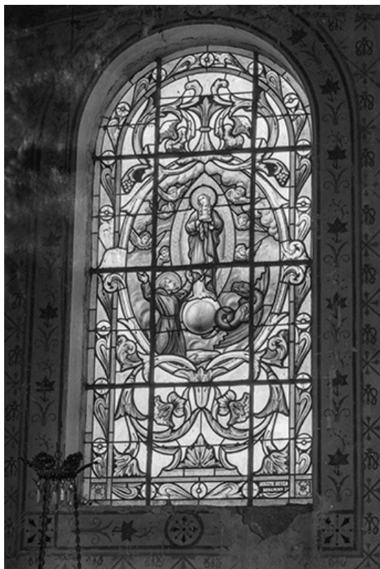
Baie 5 : vue d'ensemble.