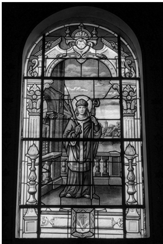
Baie 4 : vue d'ensemble.