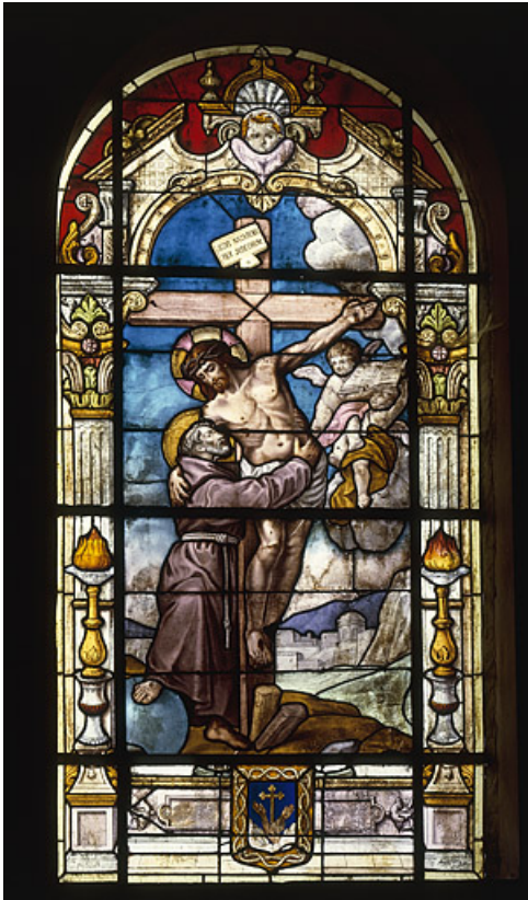
Baie 1 : vue d'ensemble.