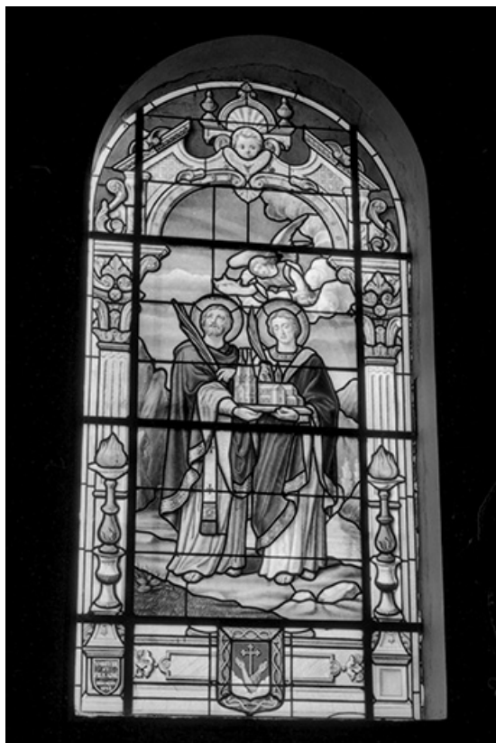
Baie 2 : vue d'ensemble.