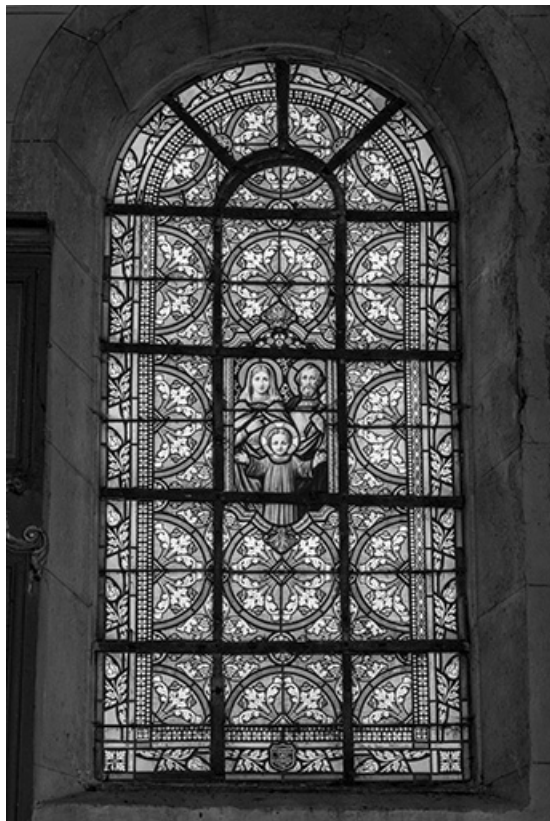
Baie 4 : vue d'ensemble.