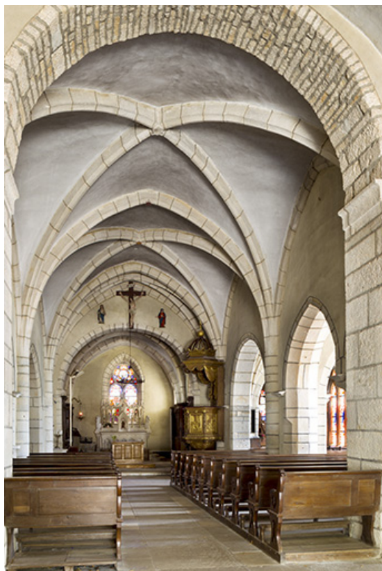
Intérieur : la nef vue de trois quart depuis l'entrée.