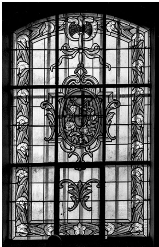
Baie n° 3 : emblèmes ou insignes de dévotion catholique.