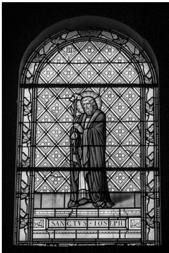
Baie 5 : vue d'ensemble.