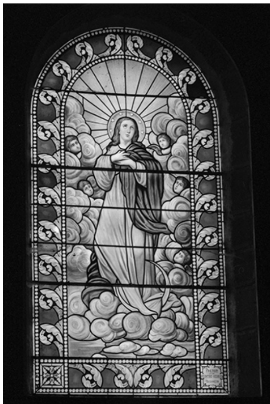
Baie 1 : vue d'ensemble.