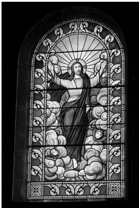
Baie 2 : vue d'ensemble.