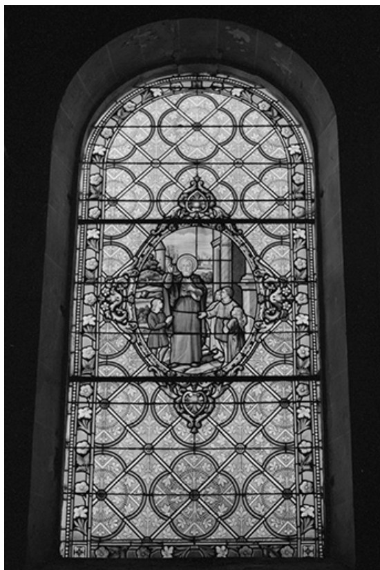
Baie 7 : vue d'ensemble.