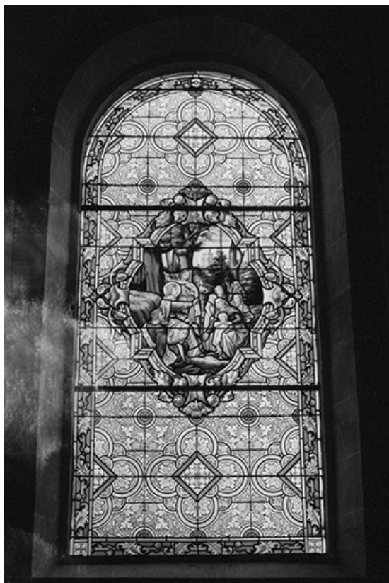
Baie 5 : vue d'ensemble.