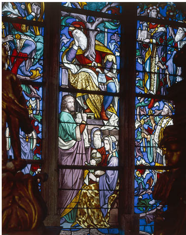
Détail de personnages situés au-dessous Jessé.