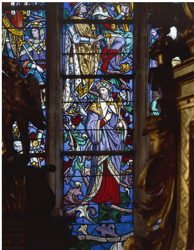
Détail d'un personnage à droite de Jessé. 70, Jonvelle rue Saint-Pierre