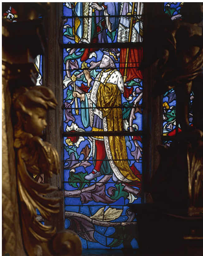
Détail d'un personnage à gauche de Jessé.