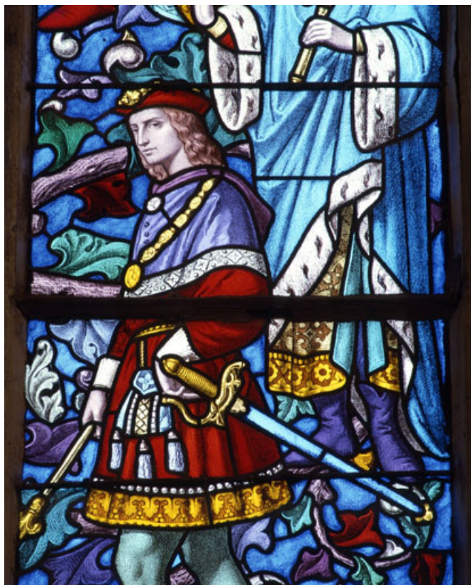
Détail : Jessé.