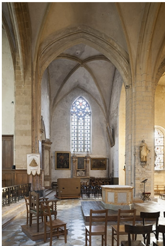
Chapelle du bras sud du transept.