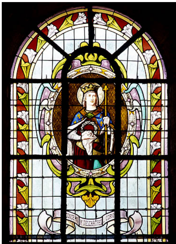
Baie 5 : partie haute.