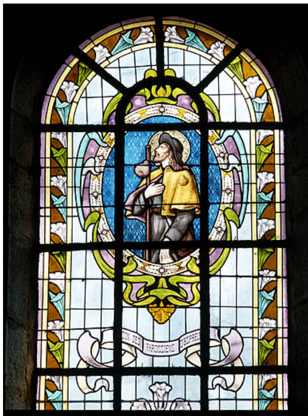
Baie 6 : partie haute.