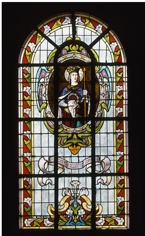
Baie 5 : vue d'ensemble.