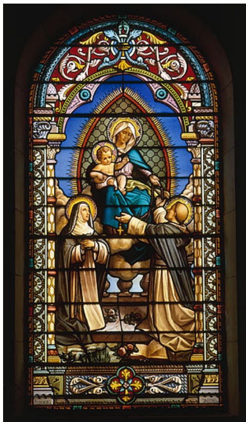
Baie 4 : Fondation de Rosaire.