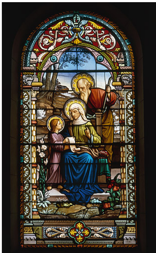
Baie 3 : sainte Famille.