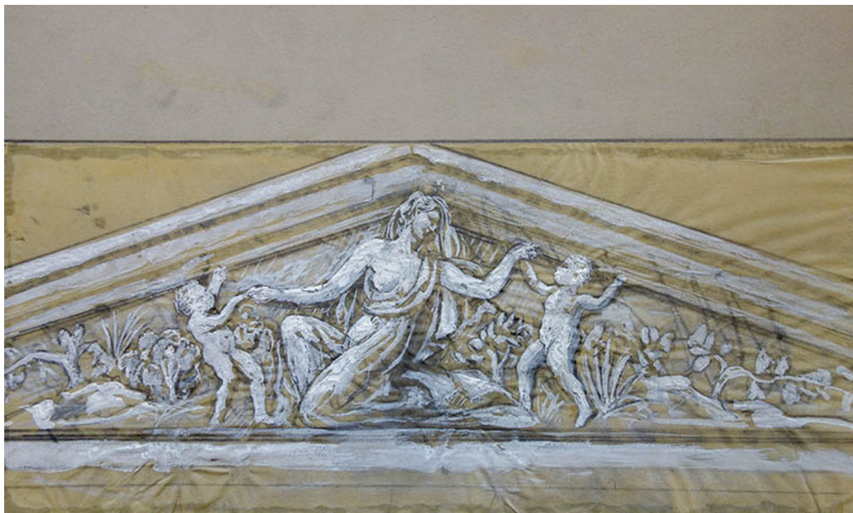
Projet de décor pour le fronton.

70, Luxeuil-les-Bains, 3 rue des Thermes