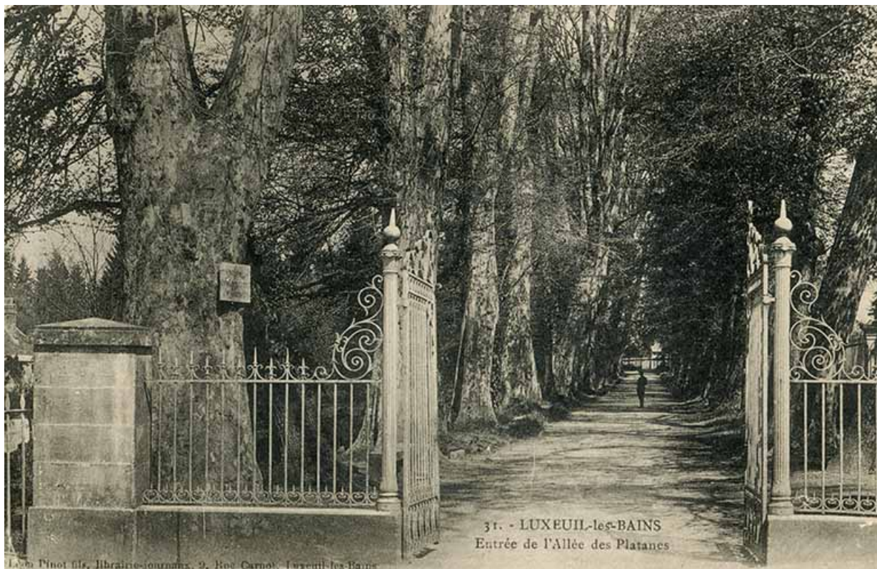
Entrée secondaire (devant l'Allée des Platanes).

70, Luxeuil-les-Bains, 3 rue des Thermes