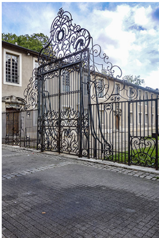
Vue de la grille remontée dans la cour du Musée Lorrain, rue Jacquot, à Nancy. 70, Luxeuil-les-Bains, 3 rue des Thermes