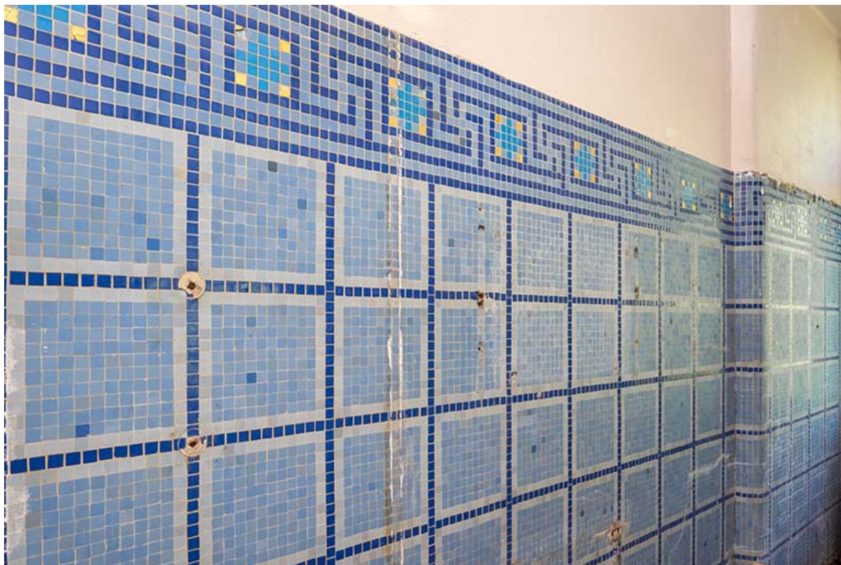
Mur sud de la dernière cabine (actuellement, local de stockage) au rez-de-chaussée de l'aile à l'est de la piscine. 70, Luxeuil-les-Bains, 3 rue des Thermes