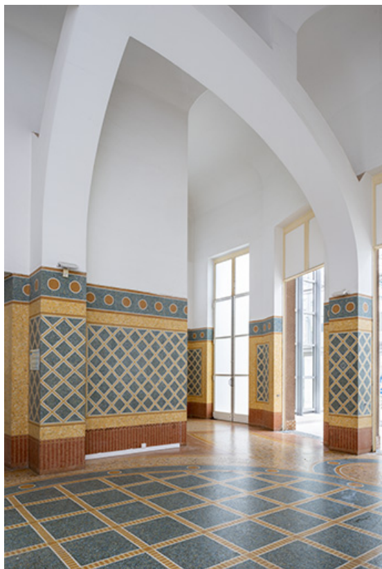
Vue d'ensemble avec le couvrement du vestibule.

70, Luxeuil-les-Bains, 3 rue des Thermes