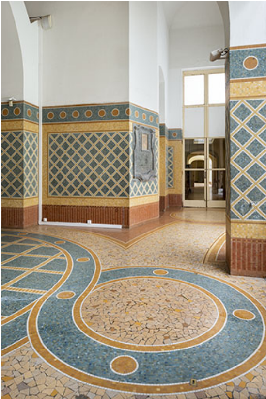
Vue depuis le vestibule en direction du couloir ouest. 70, Luxeuil-les-Bains, 3 rue des Thermes