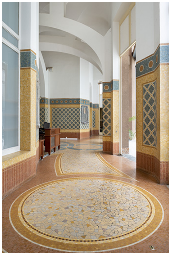
Vue depuis le couloir est.

70, Luxeuil-les-Bains, 3 rue des Thermes