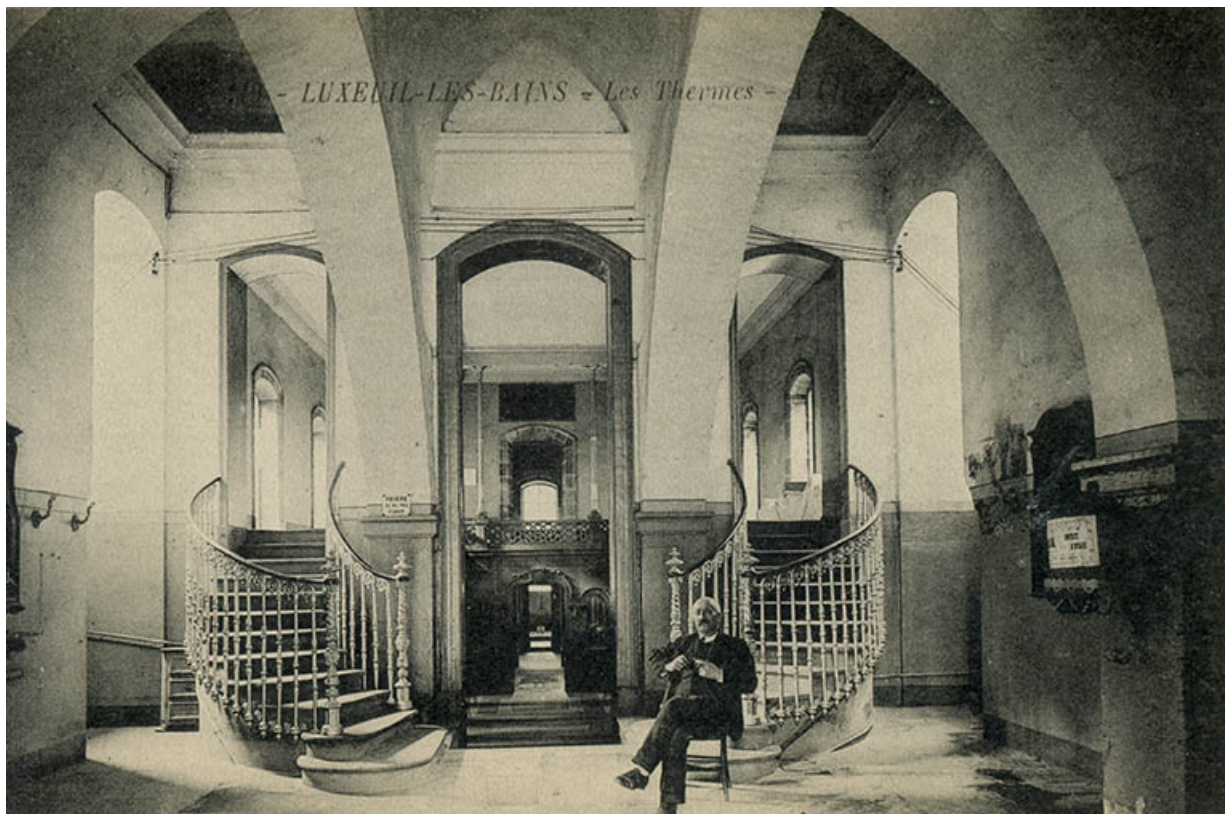
Vue d'ensemble avec le couvrement du vestibule, avant l'exécution du décor.

70, Luxeuil-les-Bains, 3 rue des Thermes