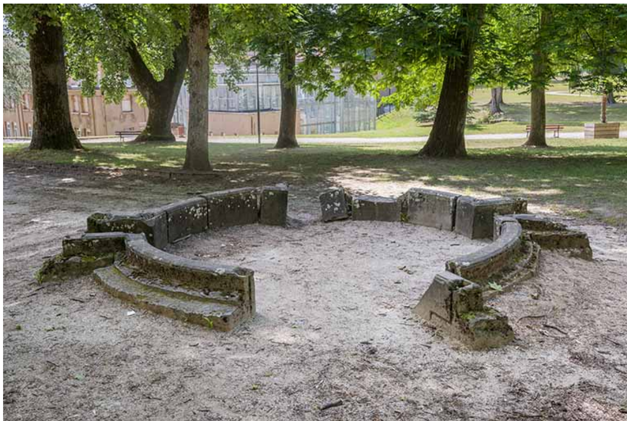
Éléments de la margelle de la piscine déposés dans le parc thermal.

70, Luxeuil-les-Bains, 3 rue des Thermes