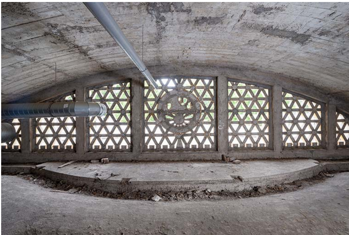
Vue de face de la claustra depuis les combles.

70, Luxeuil-les-Bains, 3 rue des Thermes