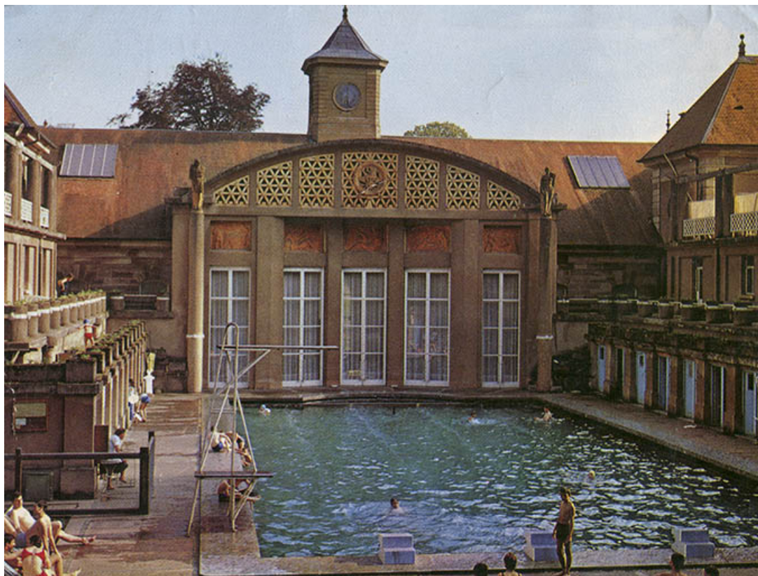
Situation de la statue, au sommet de la colonne de gauche.

70, Luxeuil-les-Bains, 3 rue des Thermes