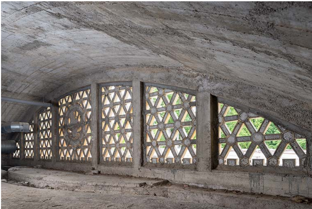
Vue de trois-quarts de la claustra depuis les combles.

70, Luxeuil-les-Bains, 3 rue des Thermes