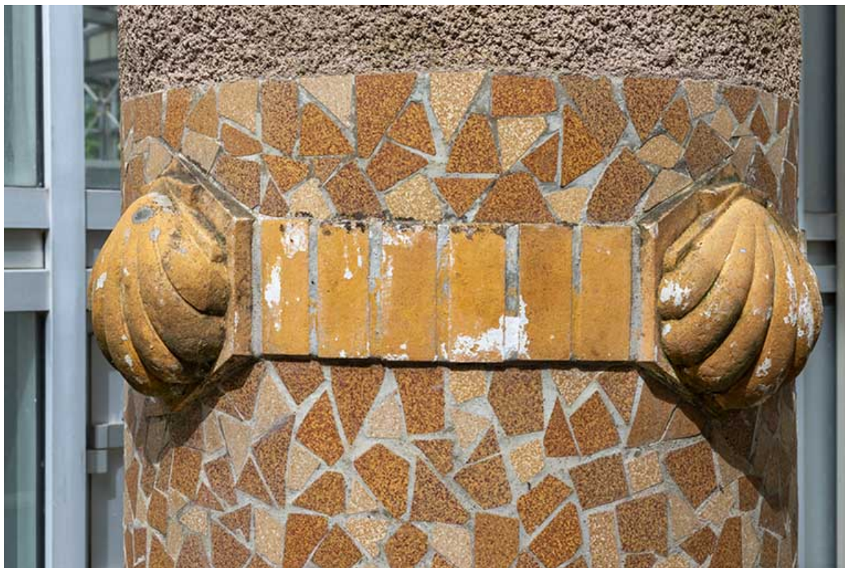
Appliques sur les colonnes portant la statue d'Hygie : coquillages.

70, Luxeuil-les-Bains, 3 rue des Thermes