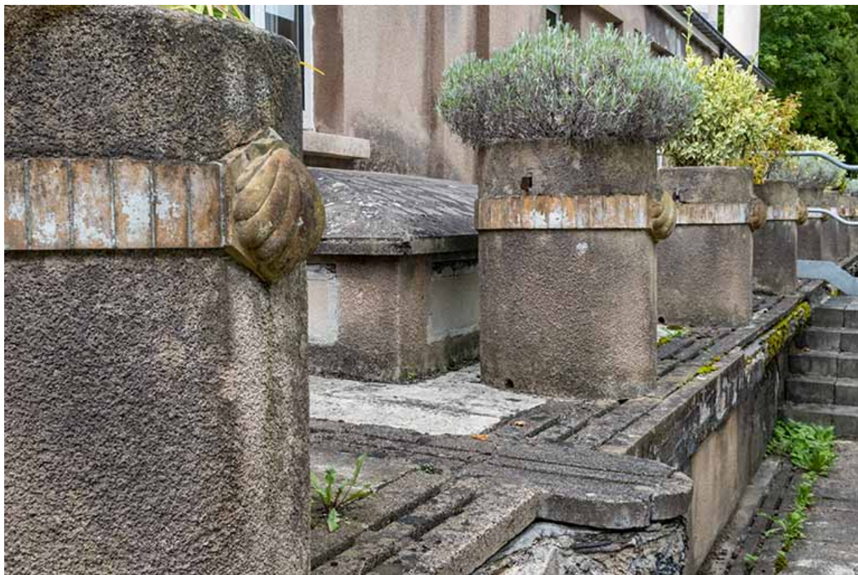
Appliques sur les pots à plantes de l'aile ouest de la piscine : coquillages.

70, Luxeuil-les-Bains, 3 rue des Thermes