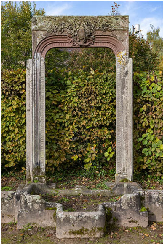
Encadrement de porte, vue de face.

70, Luxeuil-les-Bains, 3 rue des Thermes