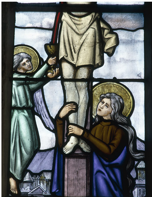
Détail : Madeleine.