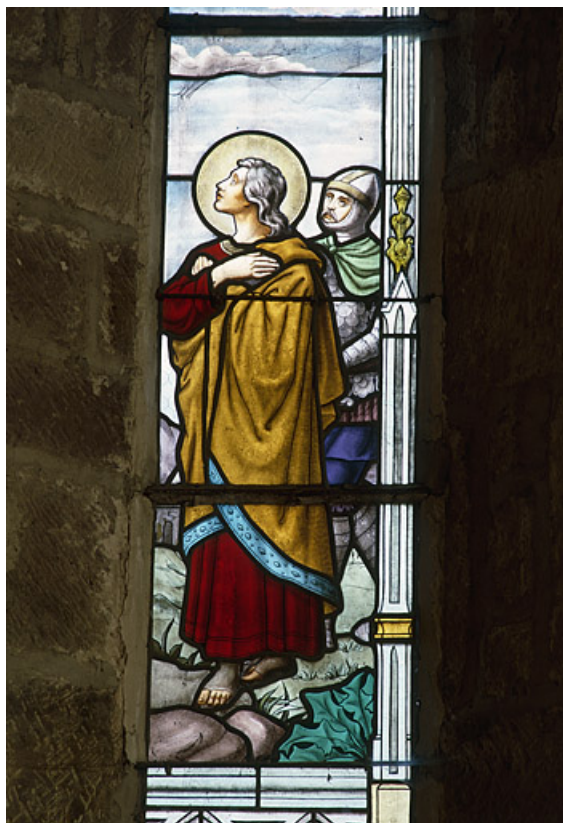
Détail : saint Jean.