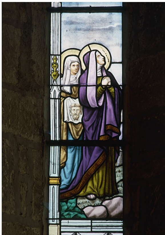
Détail : Vierge.