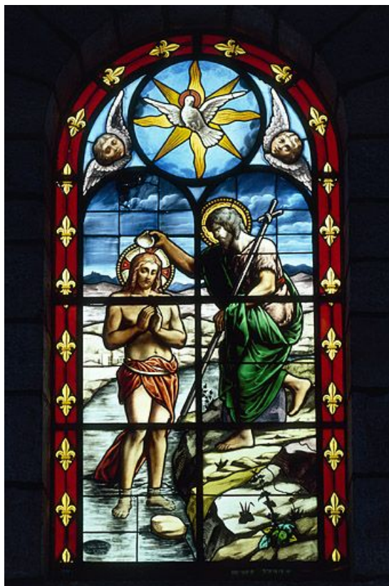
Baptême du Christ : baie 2 réalisée par l'atelier Vve J. Beyer et fils aîné à la fin du 19e siècle ou au début du 20e (grande composition, bordure de fleurs de lys).