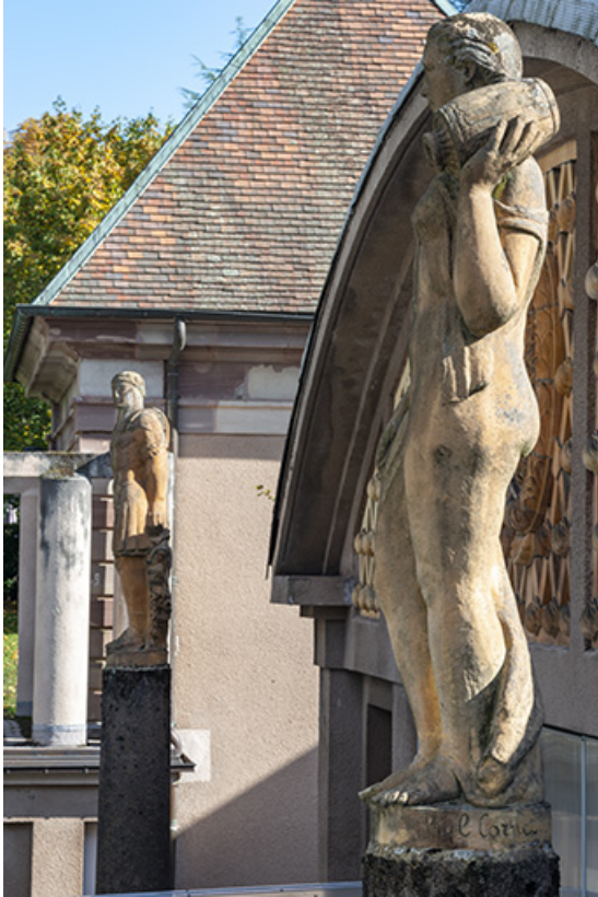
Vue de la statue depuis l'aile ouest de la piscine.

70, Luxeuil-les-Bains, 3 rue des Thermes