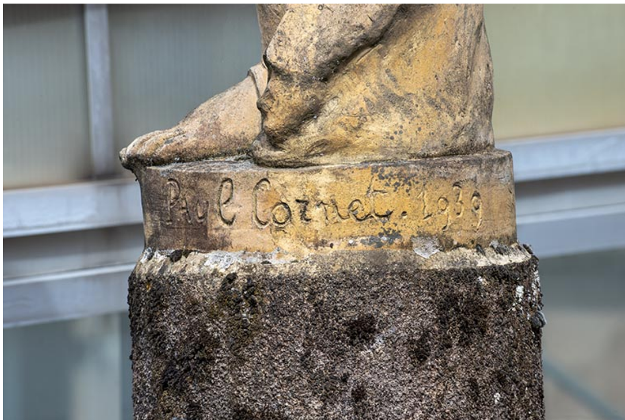
Signature du sculpteur et date sur la plinthe : "Paul Cornet 1939".

70, Luxeuil-les-Bains, 3 rue des Thermes