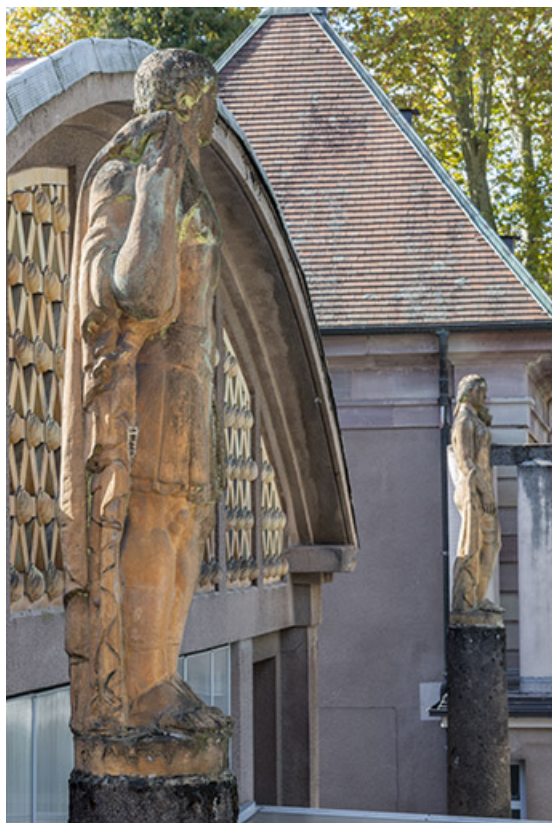
Vue de la statue depuis l'aile est de la piscine.

70, Luxeuil-les-Bains, 3 rue des Thermes