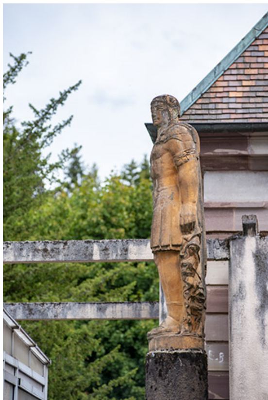
Vue de la statue depuis l'aile ouest de la piscine.

70, Luxeuil-les-Bains, 3 rue des Thermes