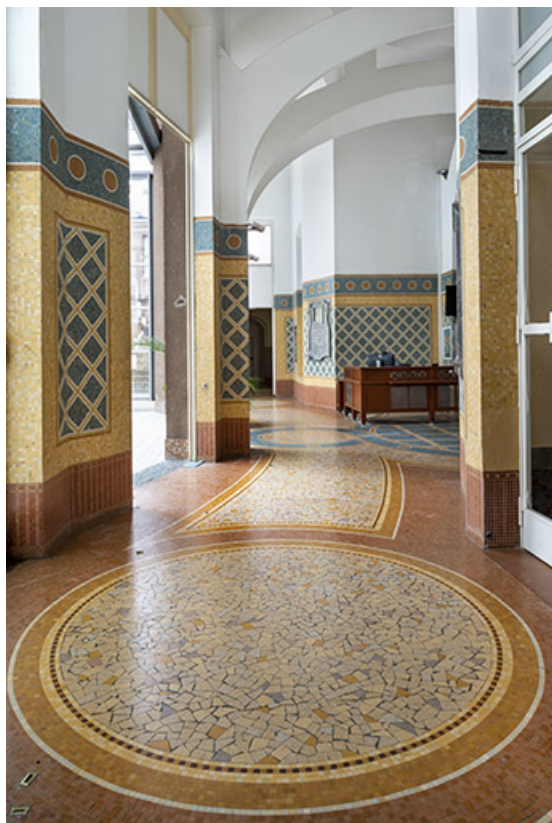
Vue depuis le couloir ouest.

70, Luxeuil-les-Bains, 3 rue des Thermes