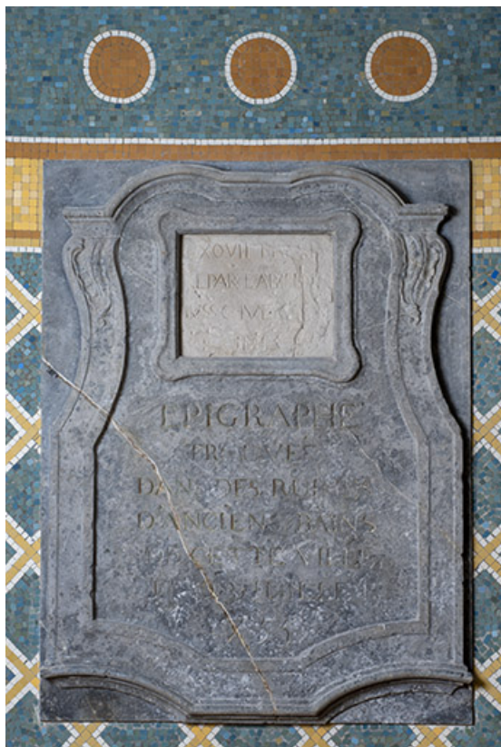
Plaque de l'inscription trouvée en 1755. 70, Luxeuil-les-Bains, 3 rue des Thermes