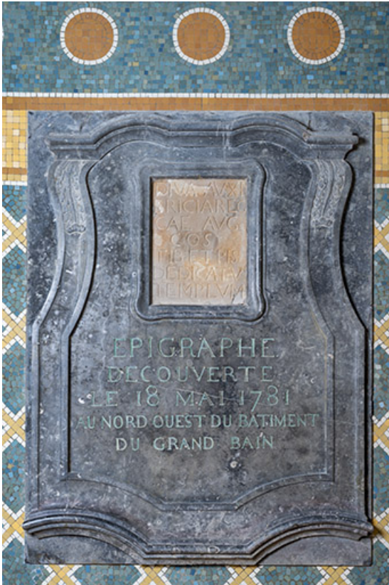
Plaque de l'inscription trouvée en 1781.

70, Luxeuil-les-Bains, 3 rue des Thermes