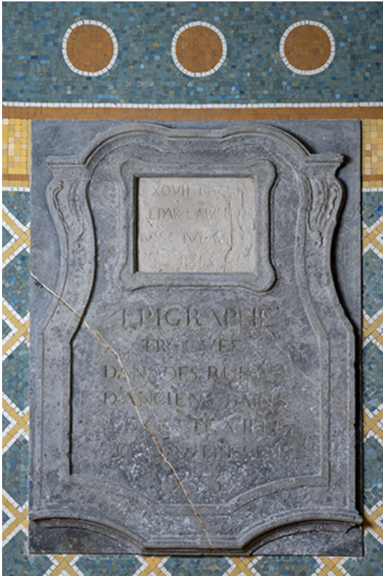
Plaque de l'inscription trouvée en 1755.

70, Luxeuil-les-Bains, 3 rue des Thermes