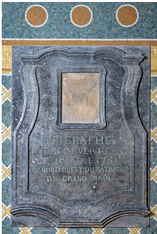
Plaque de l'inscription trouvée en 1781. 70, Luxeuil-les-Bains, 3 rue des Thermes