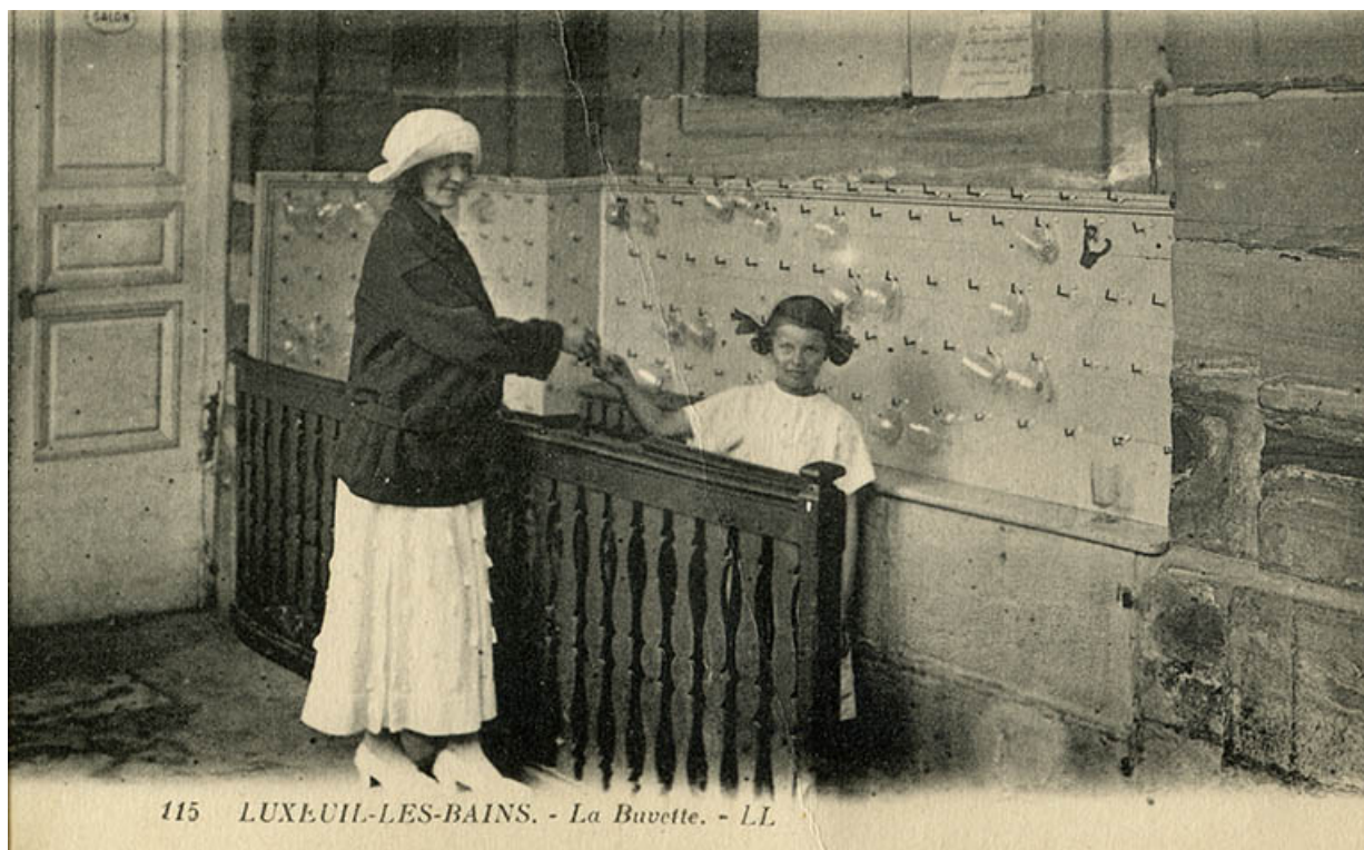
Buvette à l'extrémité ouest de la galerie ouverte du bâtiment nord dit du Grand Bain.

70, Luxeuil-les-Bains, 3 rue des Thermes