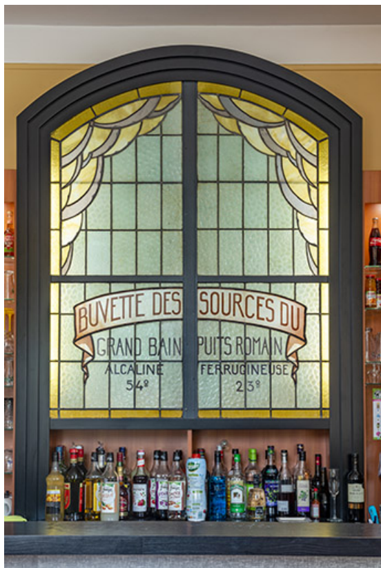
Vue de la verrière à son emplacement actuel, au-dessus du bar de l'Hôtel Métropole. 70, Luxeuil-les-Bains, 4B rue des Thermes