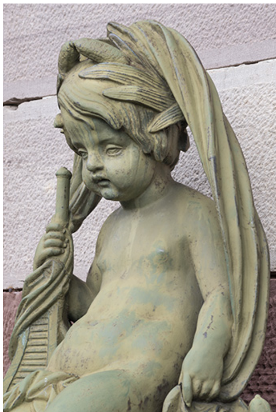
Fontaine du côté droit (est) : vue de la partie supérieure, détail de l'enfant. 70, Luxeuil-les-Bains, 3 rue des Thermes