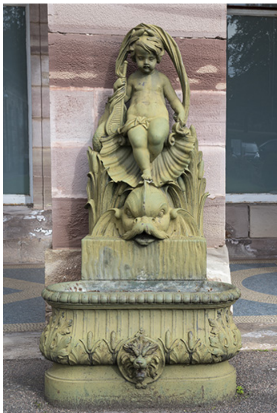
Fontaine du côté gauche (ouest) : vue d'ensemble, de face.

70, Luxeuil-les-Bains, 3 rue des Thermes