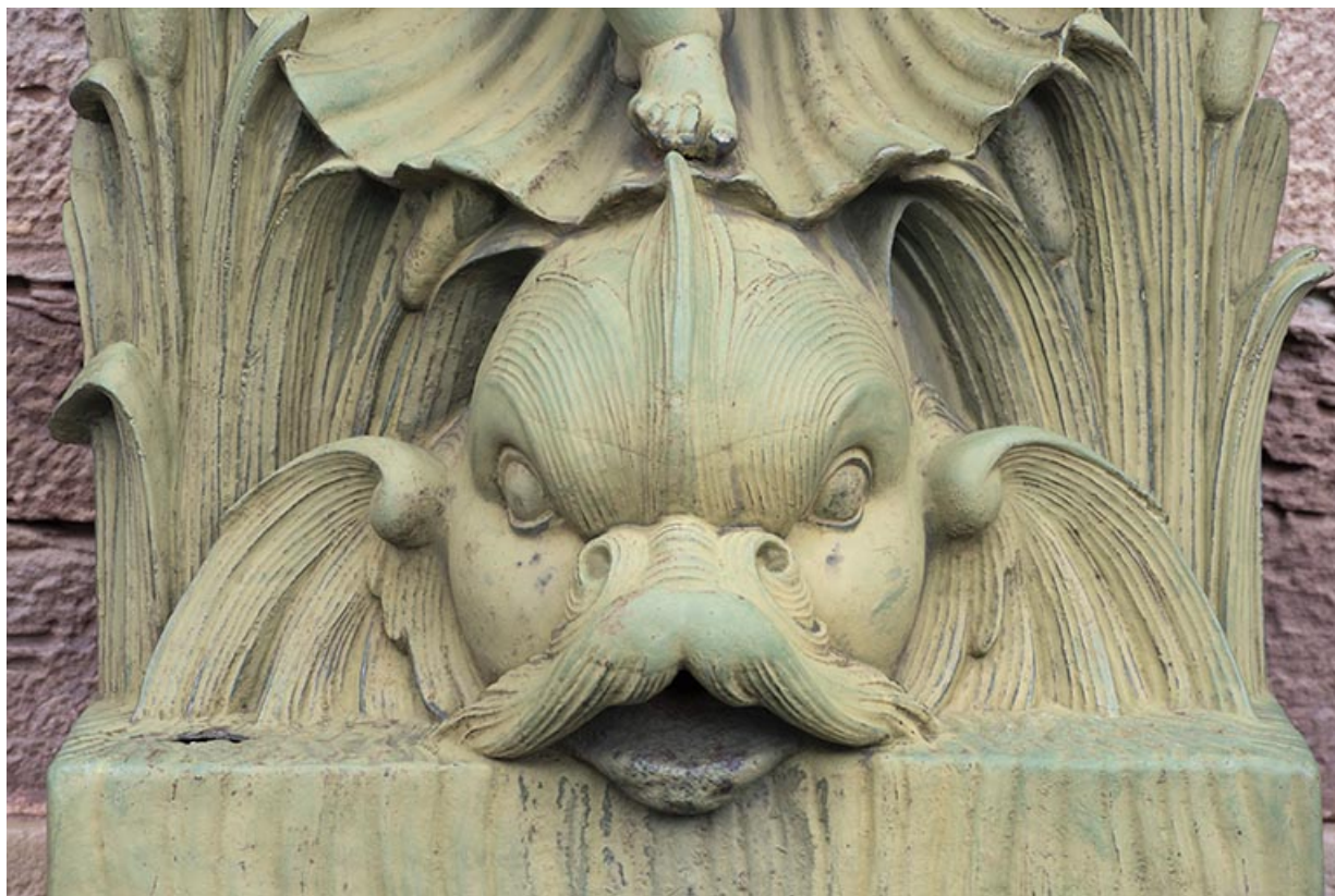
Fontaine du côté droit (est) : vue de la partie supérieure, détail du dauphin. 70, Luxeuil-les-Bains, 3 rue des Thermes