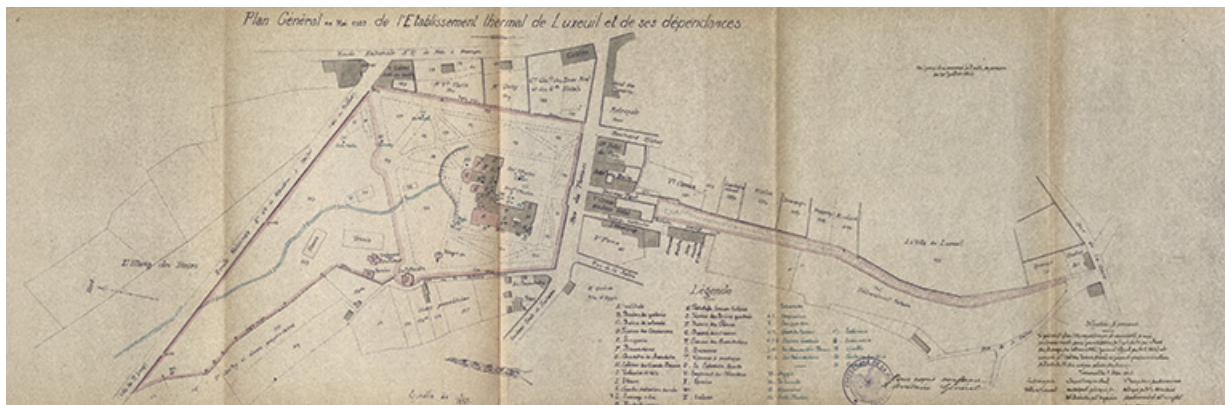
Plan de l'établissement thermal localisant la "Fontaine Martin" dans la cour en 1922.

70, Luxeuil-les-Bains, 3 rue des Thermes