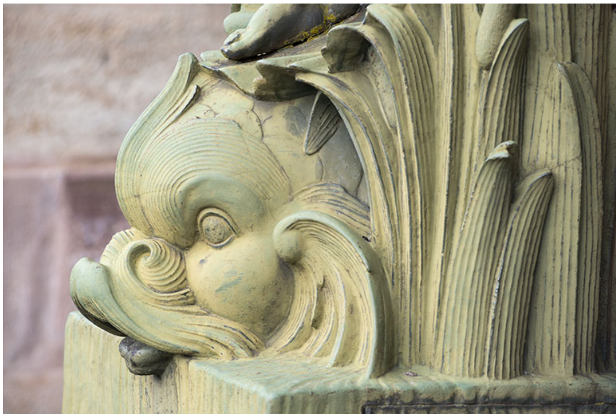
Fontaine du côté droit (est) : vue de la partie supérieure, détail du dauphin. 70, Luxeuil-les-Bains, 3 rue des Thermes