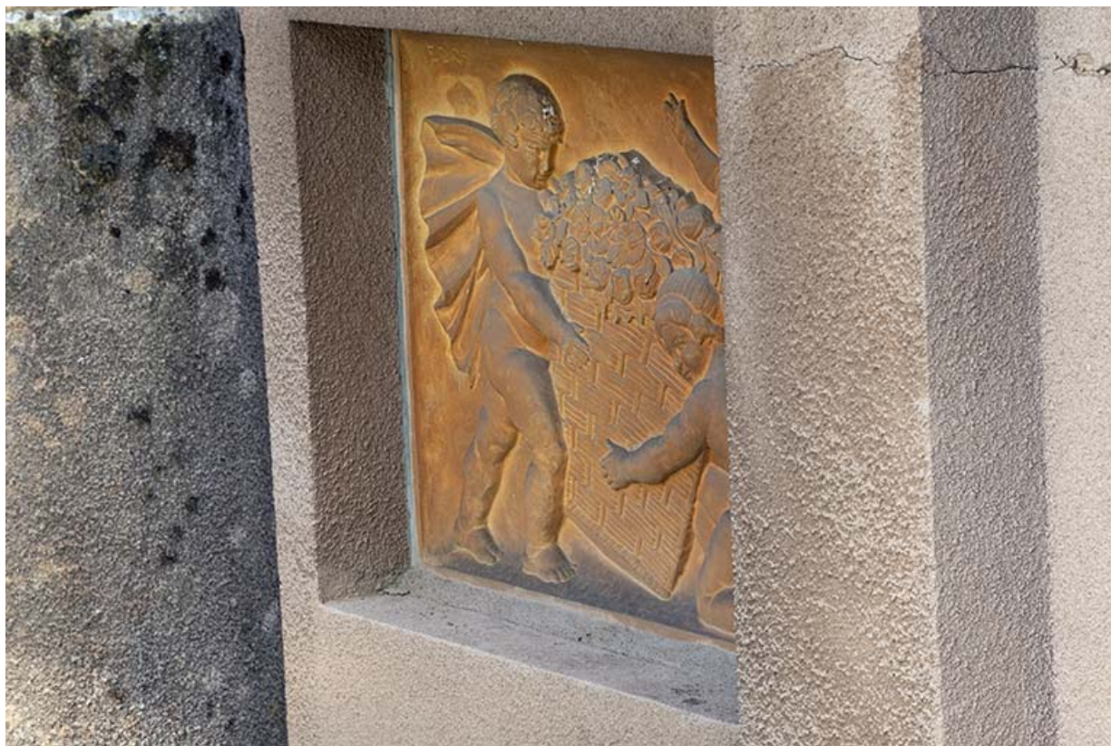
Enfants à la corbeille (relief n°5).

70, Luxeuil-les-Bains, 3 rue des Thermes