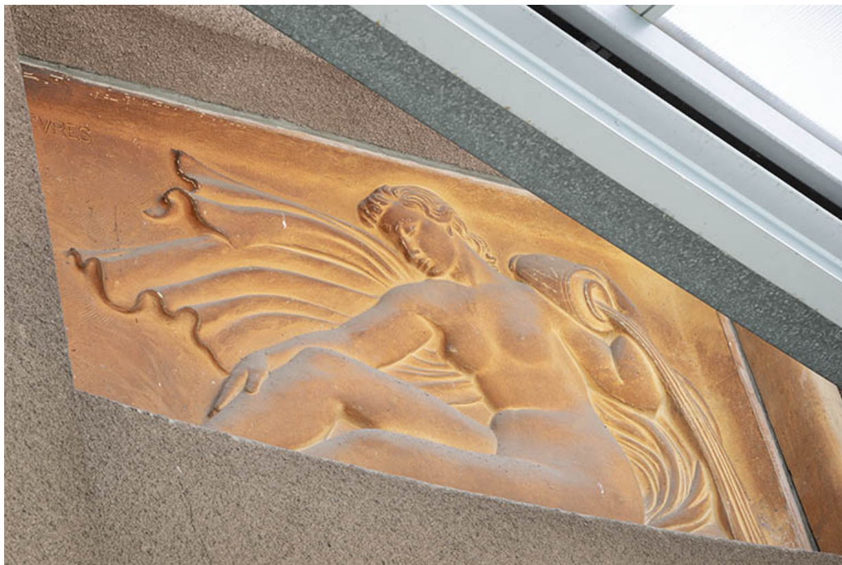
Femme assise, amphore sur l'épaule (relief n°4).

70, Luxeuil-les-Bains, 3 rue des Thermes