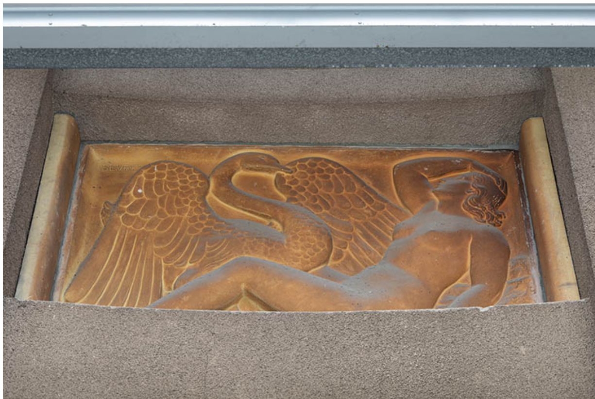
Léda et le cygne (relief n°3).

70, Luxeuil-les-Bains, 3 rue des Thermes