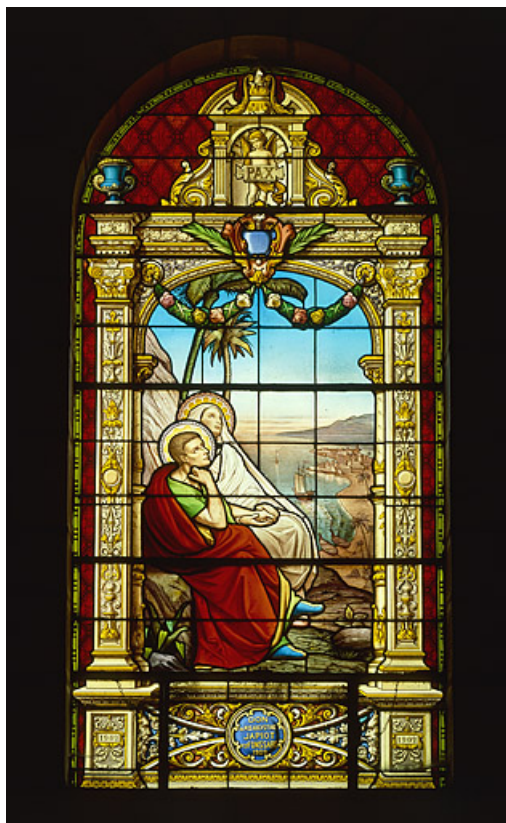
Baie 5 : vue d'ensemble.