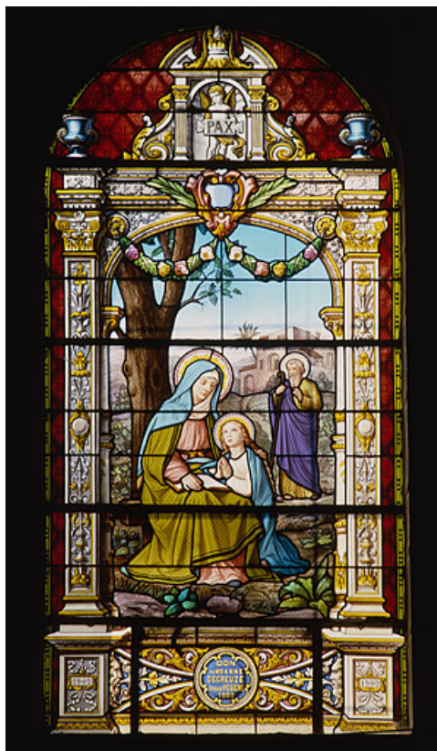
Baie 6 : vue d'ensemble.