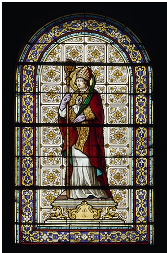
Baie 7 : saint Ferréol.