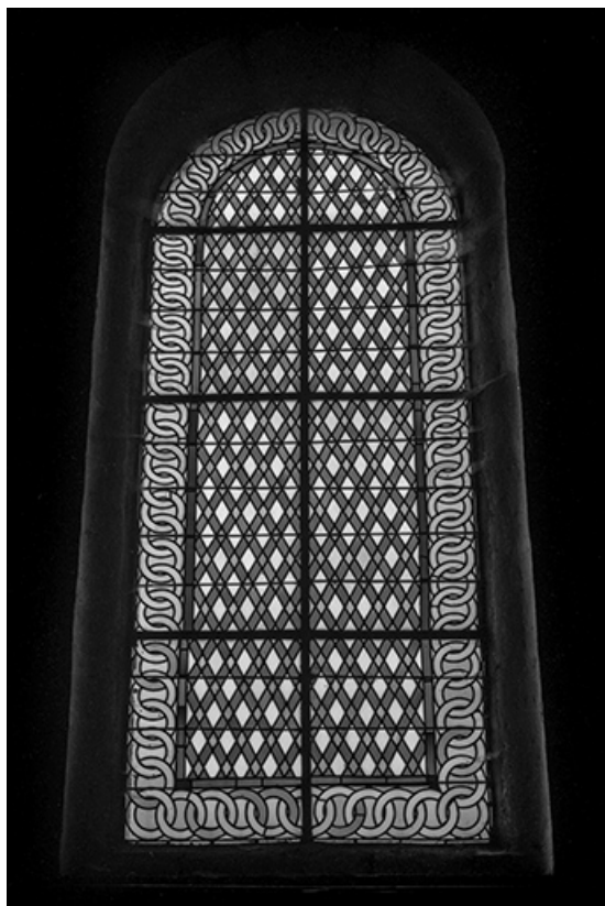
Baie 4 : vue d'ensemble.