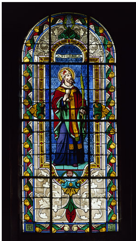
Baie 2 : vue d'ensemble.