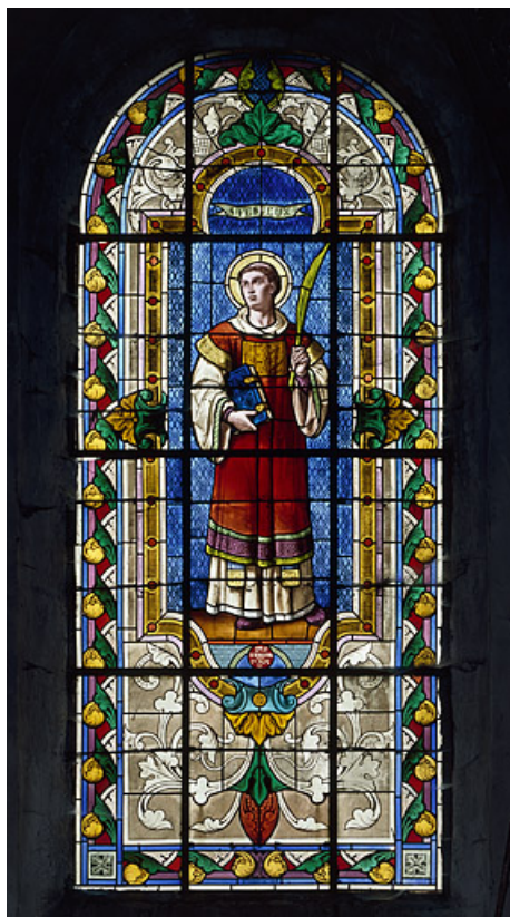
Baie 1 : vue d'ensemble.