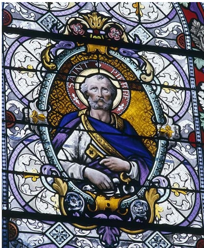
Baie 1 : saint Pierre.