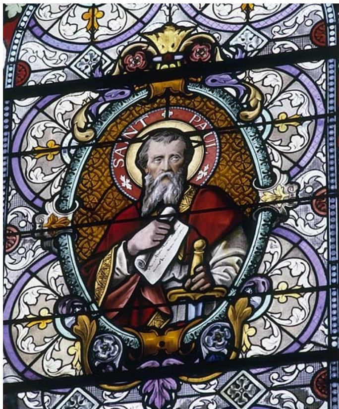
Baie 2 : saint Paul.