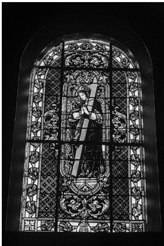
Baie 4 : vue d'ensemble.