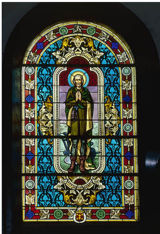
Baie 5 : vue d'ensemble.