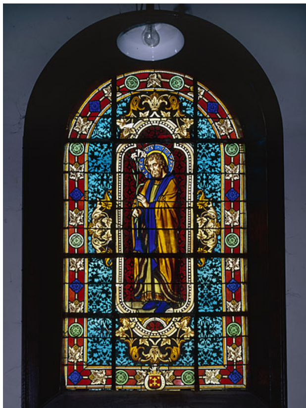
Baie 6 : vue d'ensemble.