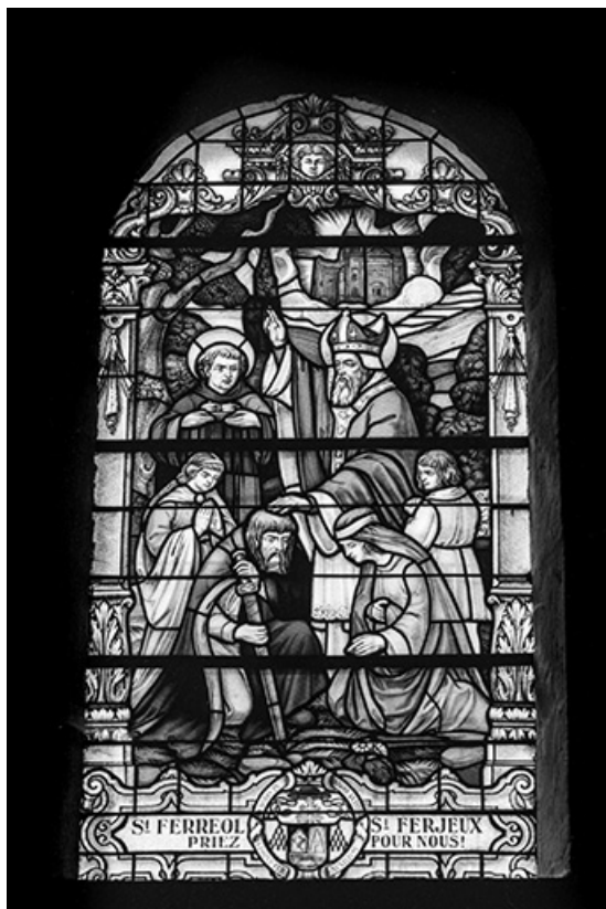
Baie 6 : saint Ferréol et saint Ferjeux baptisant.

70, Aboncourt-Gesincourt, lieudit : Aboncourt