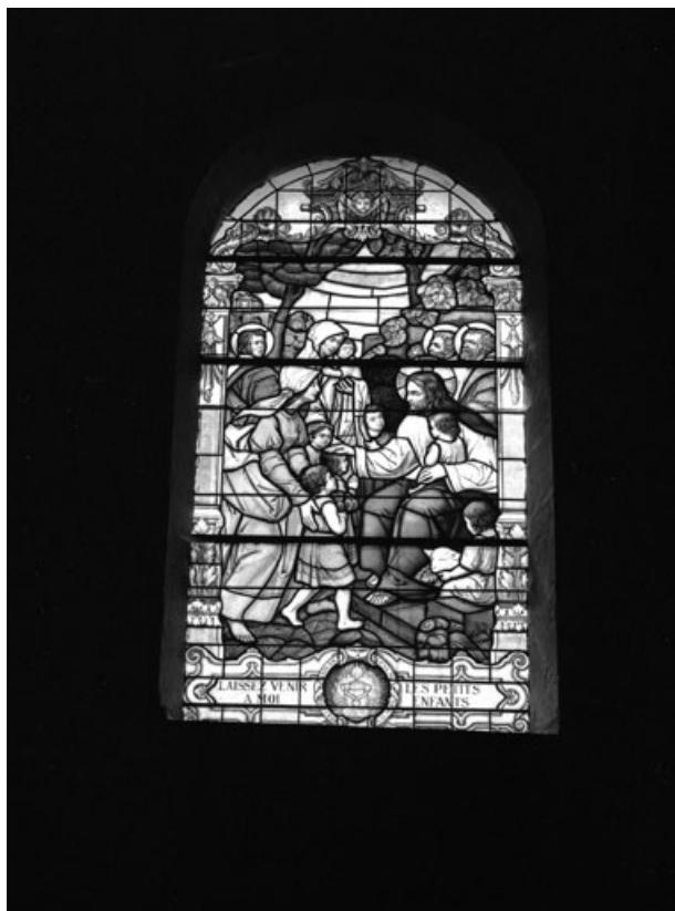
Baie 10 : le Christ accueillant les petits enfants.

70, Aboncourt-Gesincourt, lieudit : Aboncourt