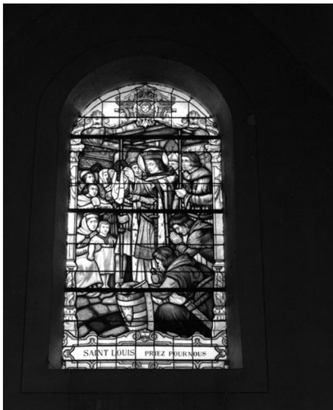
Baie 7 : saint Louis rapportant la couronne d'épines.

70, Aboncourt-Gesincourt, lieudit : Aboncourt