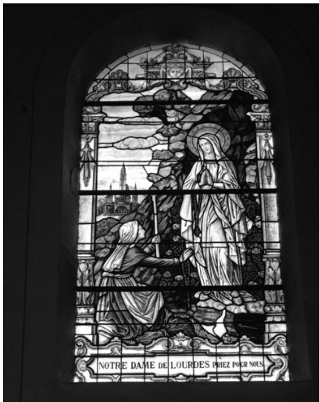
Baie 1 : Apparition de la Vierge à Lourdes. 70, Aboncourt-Gesincourt, lieudit : Aboncourt