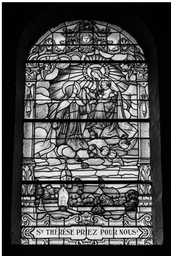
Baie 8 : sainte Thérèse reçue au ciel par la Vierge et l'Enfant.

70, Aboncourt-Gesincourt, lieudit : Aboncourt