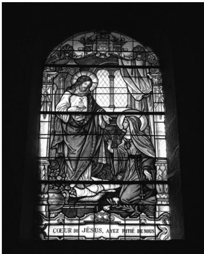
Baie 2 : Apparition du Sacré-Coeur à Marguerite-Marie Alacoque.

70, Aboncourt-Gesincourt, lieudit : Aboncourt