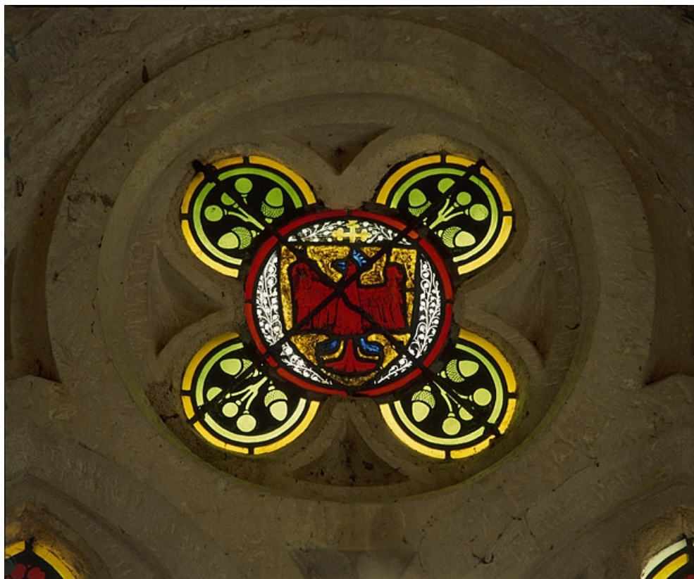
Détail du tympan : quadrilobe avec écu armorié de Thiebaud de Rougemont. 70, Charcenne, lieudit : Leffond