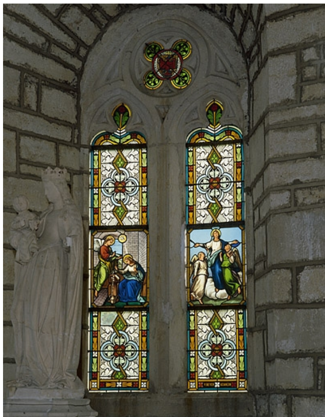
Vue d'ensemble : deux lancettes (Annonciation et Assomption) et quadrilobe avec écu armorié de Thiebaud de Rougemont. 70, Charcenne, lieudit : Leffond