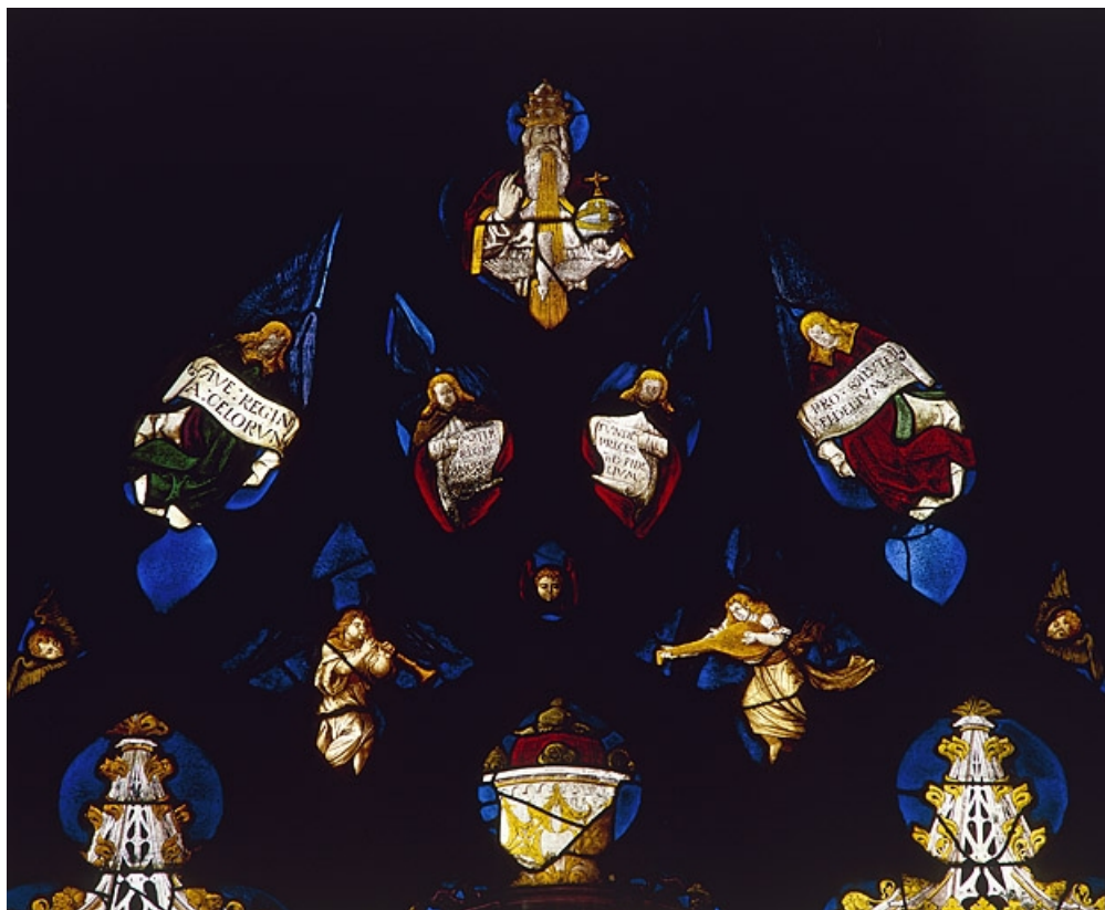
Tympan : 2 anges musiciens, 3 têtes d'anges, 4 anges portant des phylactères avec inscriptions, Dieu le Père bénissant et Saint Esprit.

70, Beaujeu-Saint-Vallier-Pierrejux-et-Quitteur, lieudit : Beaujeu