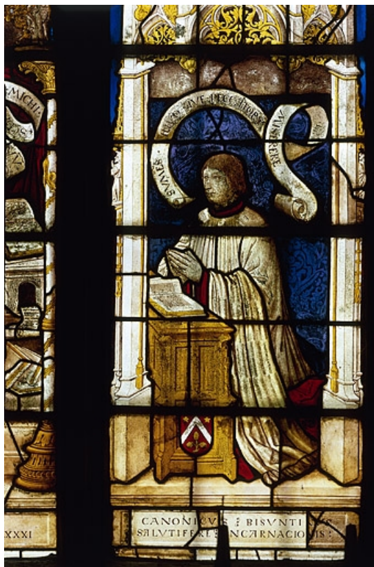
Lancette droite : donateur

70, Beaujeu-Saint-Vallier-Pierrefix-et-Quitteur, lieudit : Beaujeu