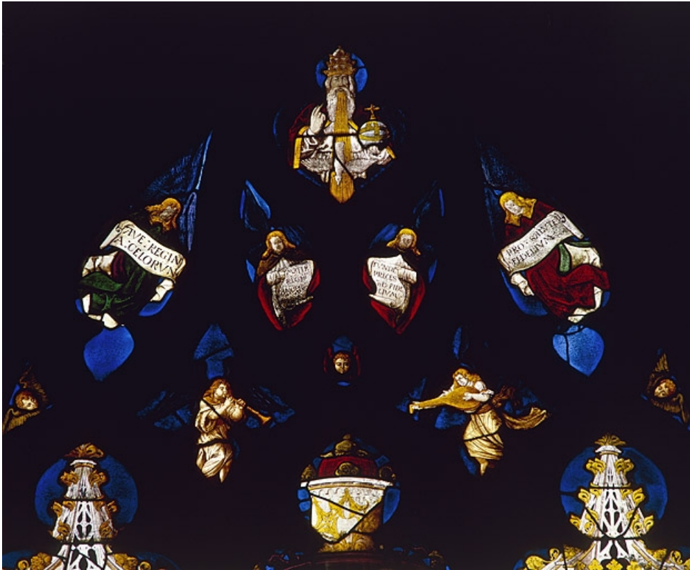
Tympan : 2 anges musiciens, 3 têtes d'anges, 4 anges portant des phylactères avec inscriptions, Dieu le Père bénissant et Saint Esprit.

70, Beaujeu-Saint-Vallier-Pierrejux-et-Quitteur, lieudit : Beaujeu