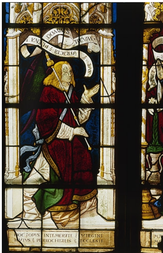
Lancette gauche : ange de l'Annonciation

70, Beaujeu-Saint-Vallier-Pierrejux-et-Quitteur, lieudit : Beaujeu