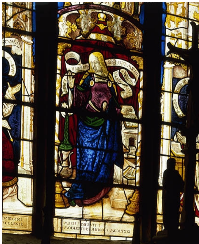
Lancette centrale : Vierge de l'Annonciation

70, Beaujeu-Saint-Vallier-Pierrejux-et-Quitteur, lieudit : Beaujeu