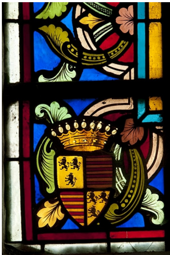
Détail : armoiries de la comtesse de Poinctes. 70, Faverney place Sainte-Gude