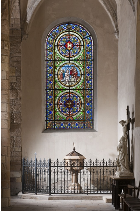
Chapelle des fonts baptismaux.