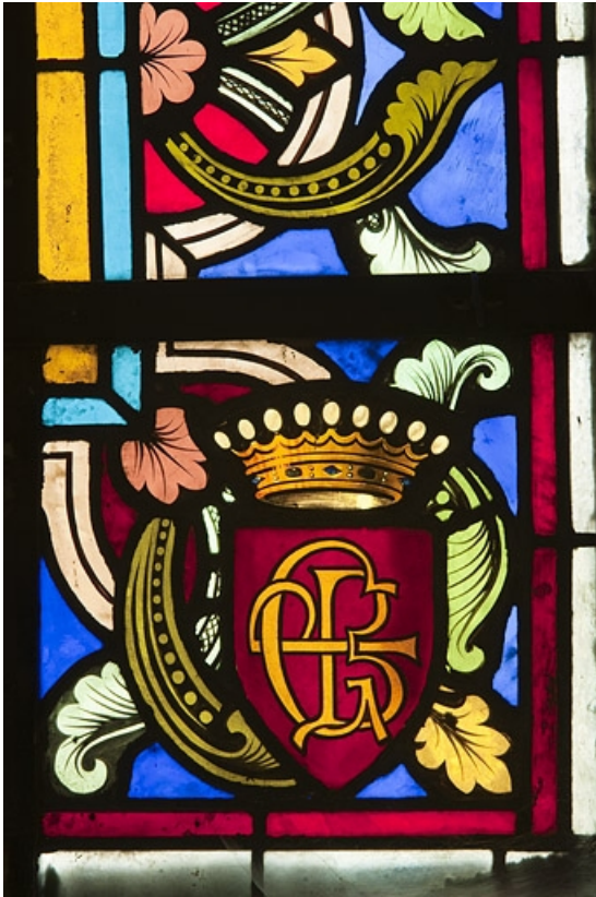
Détail : armoiries de la famille de Poinctes et de Gevigney. 70, Faverney place Sainte-Gude