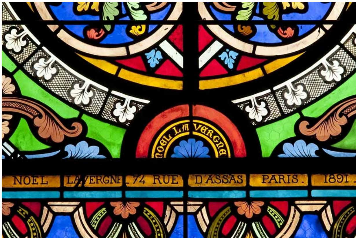
Détail : inscription concernant l'auteur et la date.