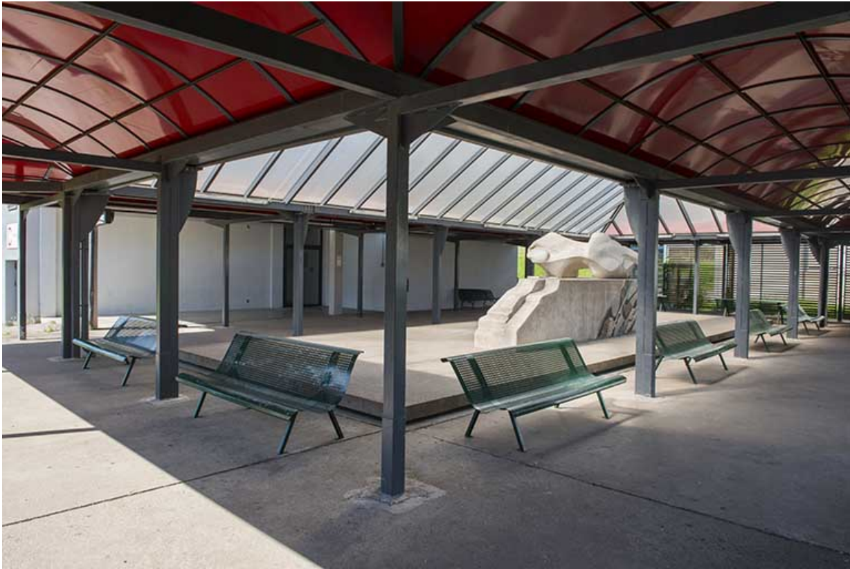
L'oeuvre dans son contexte, sous son préau.