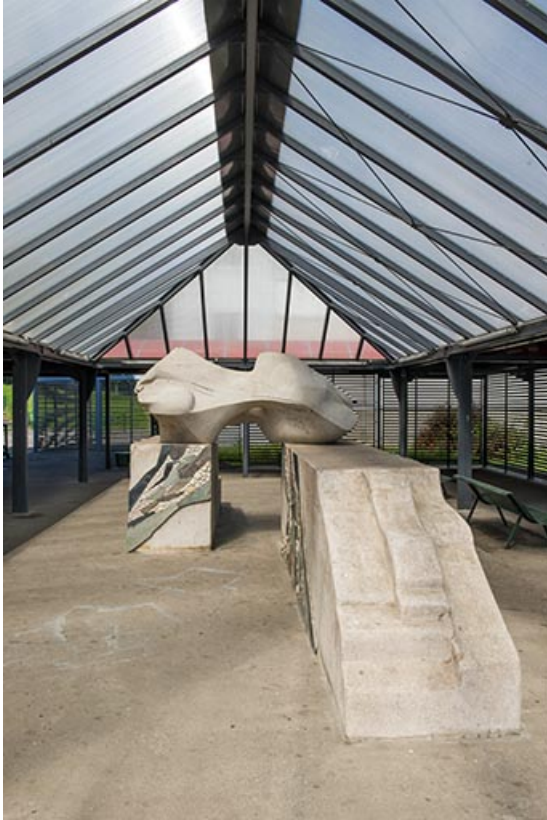
Oeuvre d'Oudot et Bergeret vue de l'est.