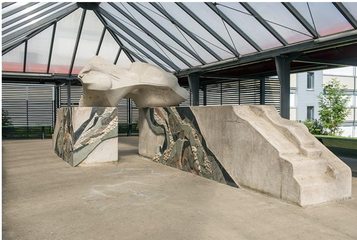
Oeuvre d'Oudot et Bergeret, vue du sud-est.