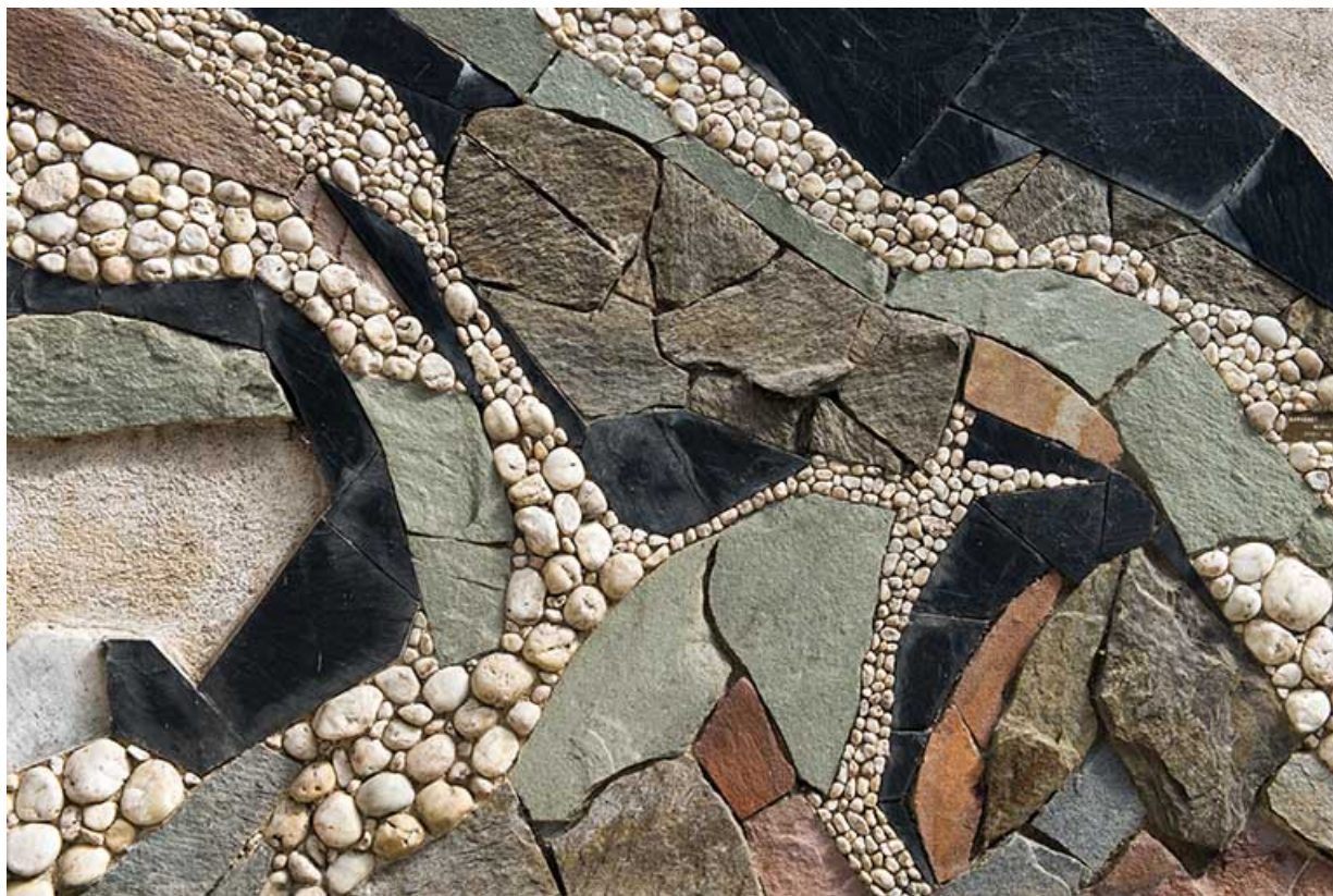
Détail de l'assemblage des matériaux.