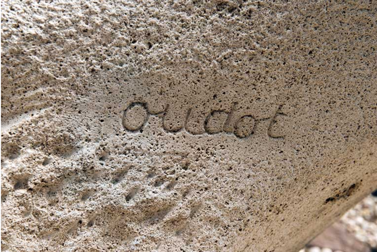
Détail : signature d'Oudot.