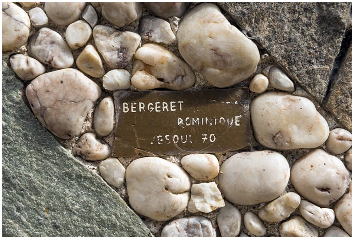
Détail : signature de Bergeret.