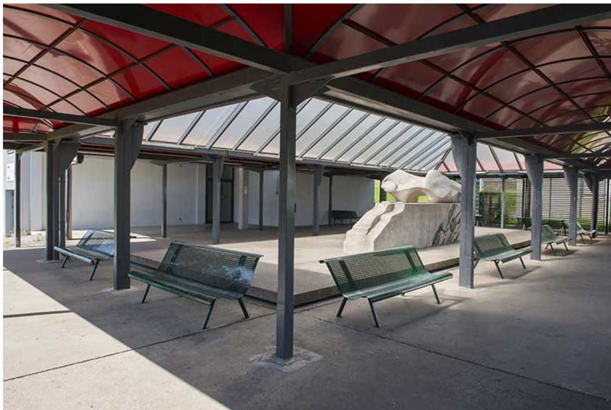
L'oeuvre dans son contexte, sous son préau.