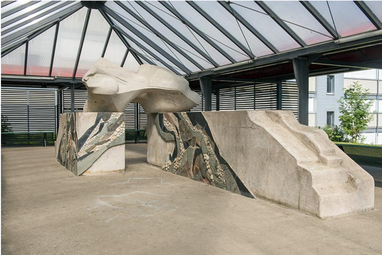
Oeuvre d'Oudot et Bergeret, vue du sud-est.