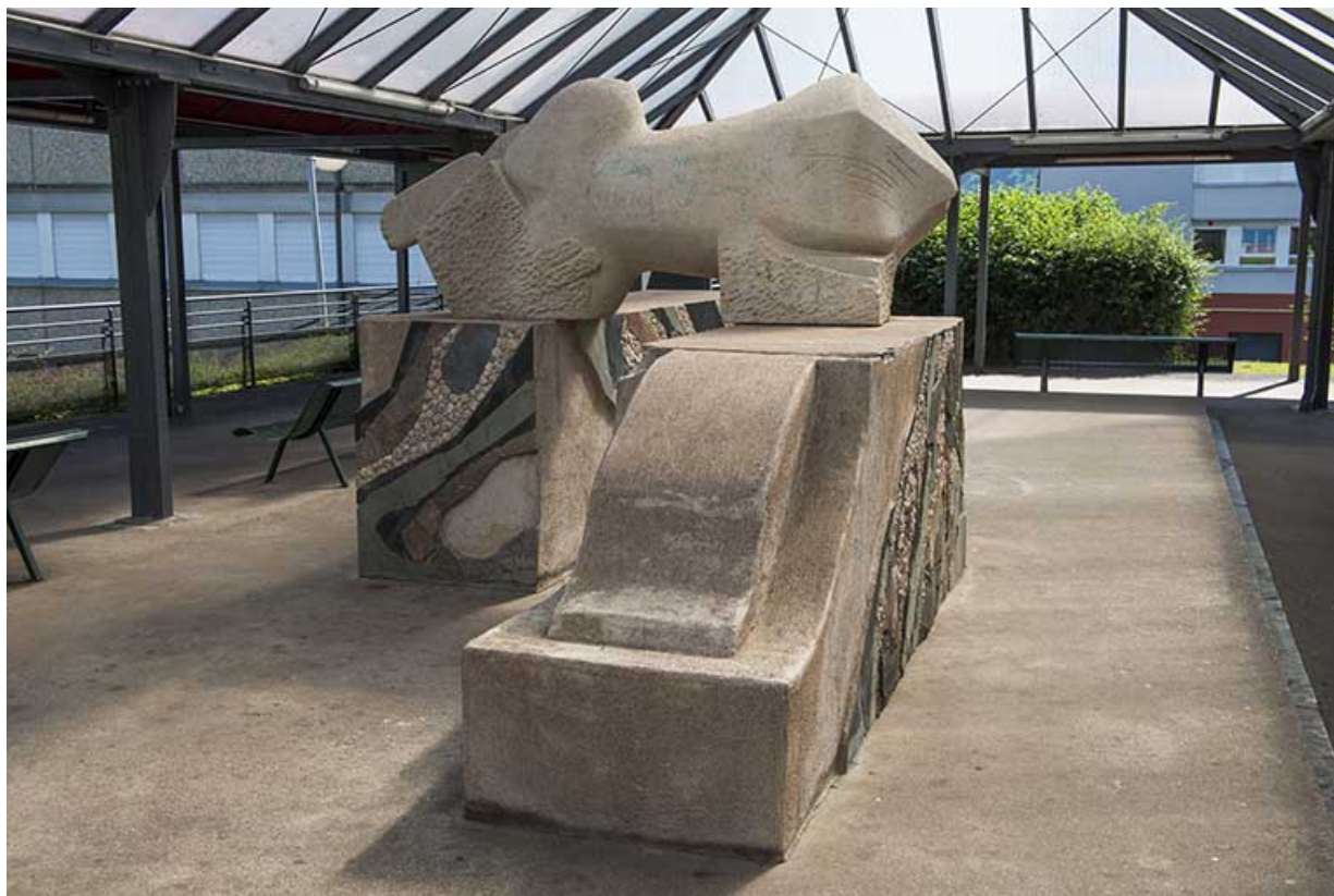
Oeuvre d'Oudot et Bergeret, vue du sud-ouest.