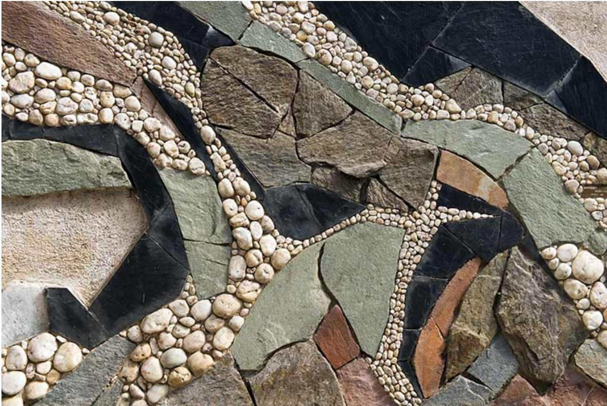
Détail de l'assemblage des matériaux.