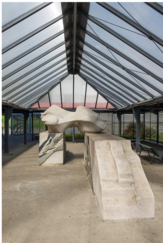
Oeuvre d'Oudot et Bergeret vue de l'est.