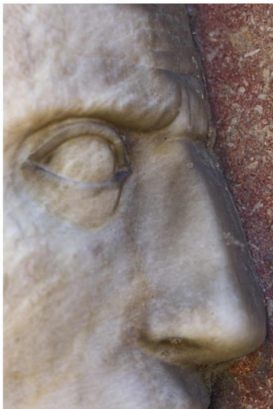
Auguste : détail du nez et de l'oeil.