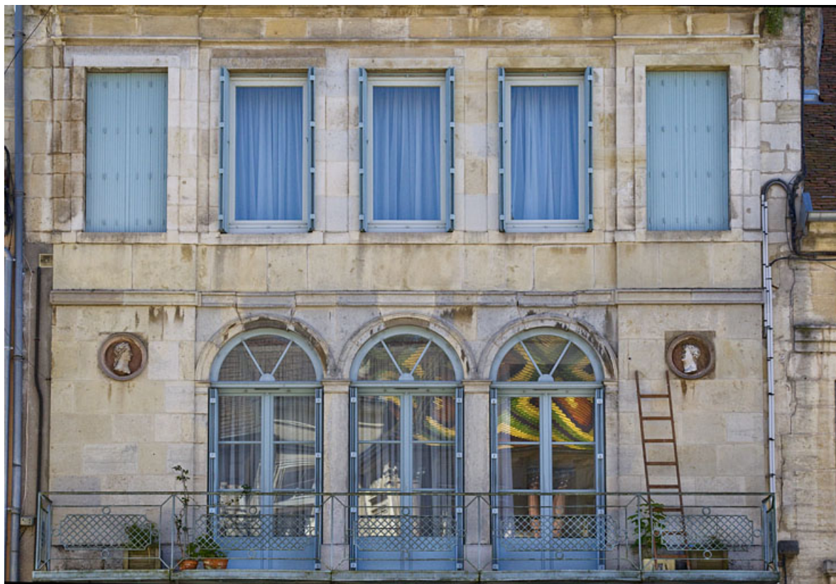
Vues d'ensemble des oeuvres, au premier étage de la façade antérieure.