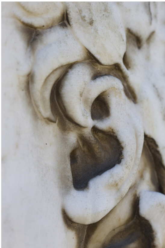
Néron : détail de l'oreille.