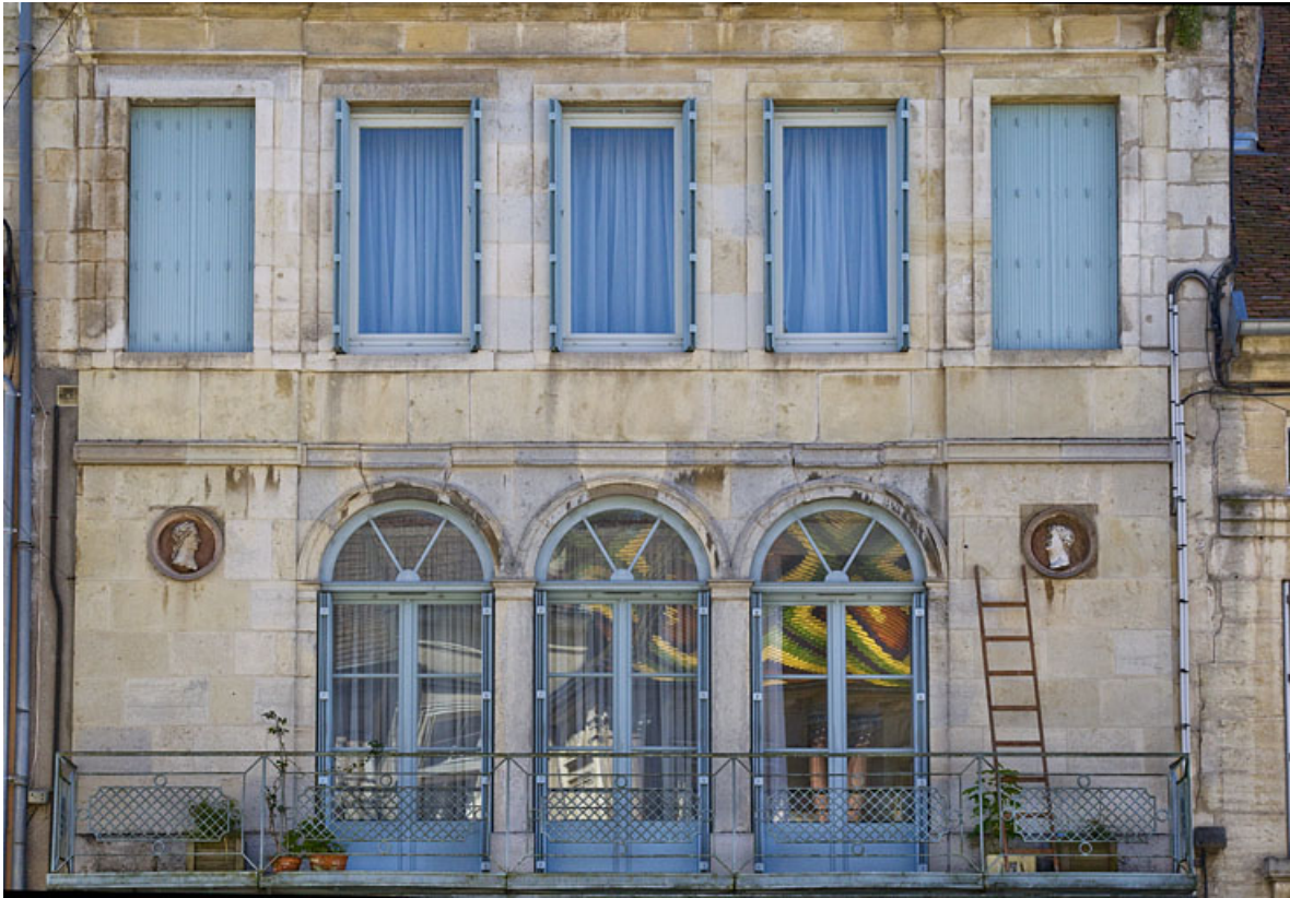
Vues d'ensemble des oeuvres, au premier étage de la façade antérieure.