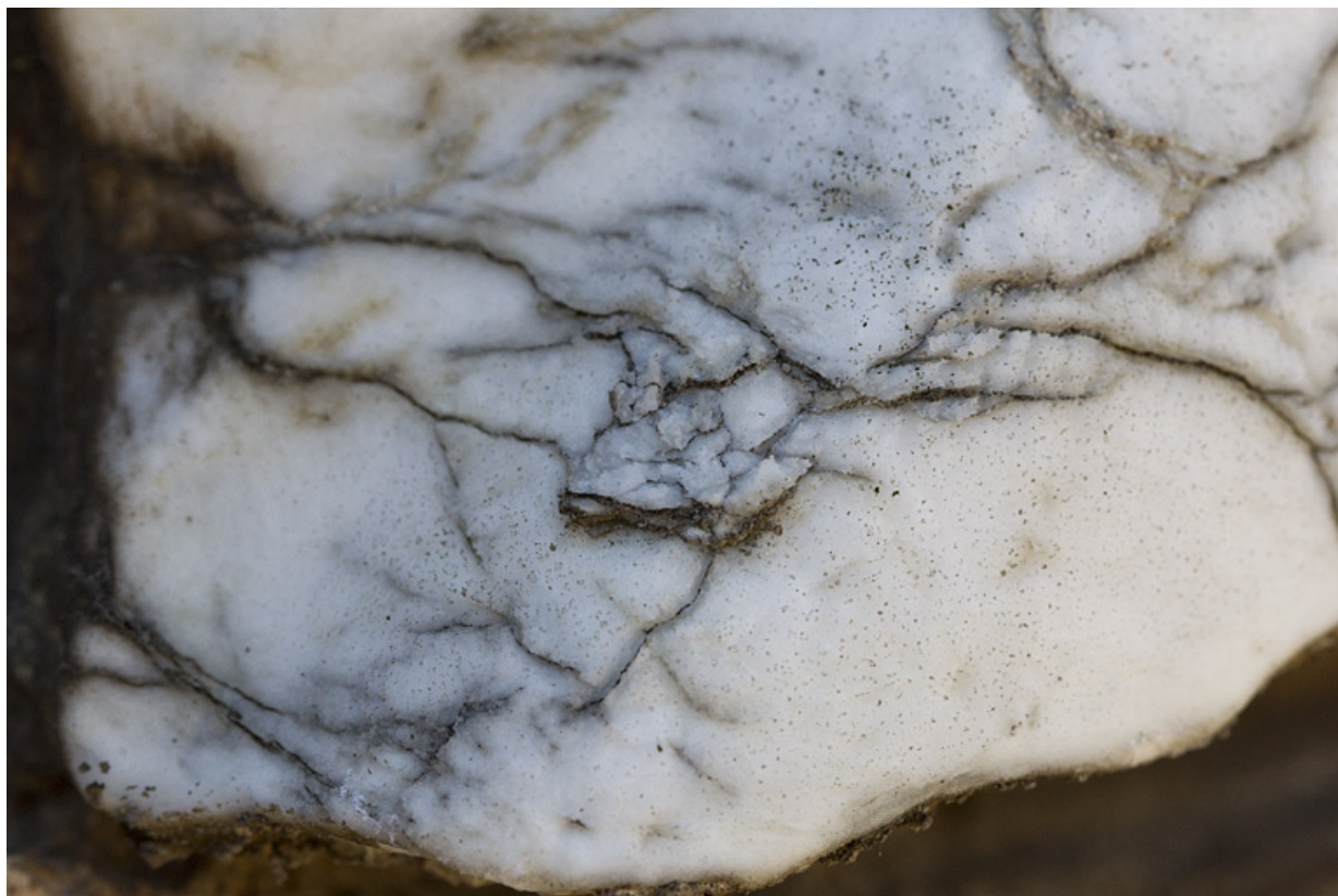
Néron : altération de l'albâtre au niveau du cou.