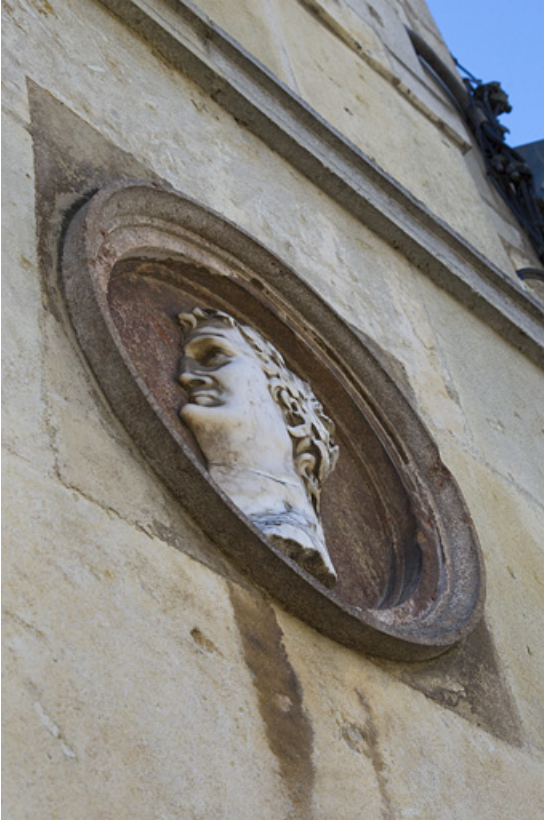
Néron : vue de profil et en contre-plongée.