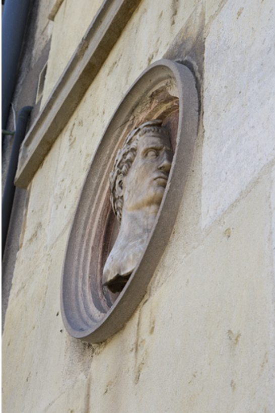
Auguste : vue de profil et en contre-plongée.