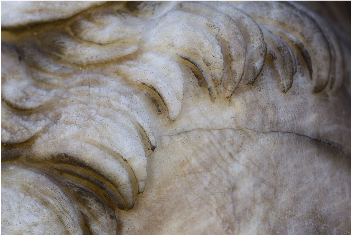
Auguste : détail des cheveux.