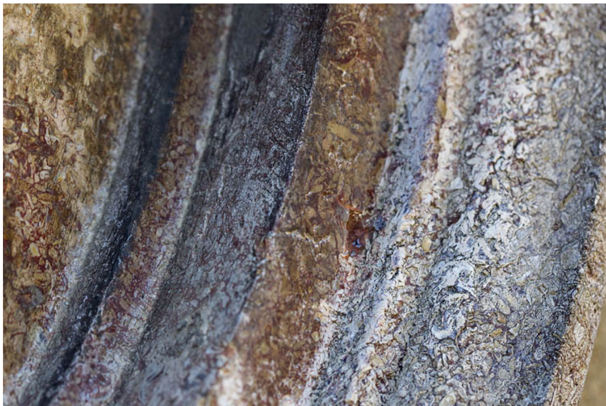
Néron : détail de la moulure du médaillon.