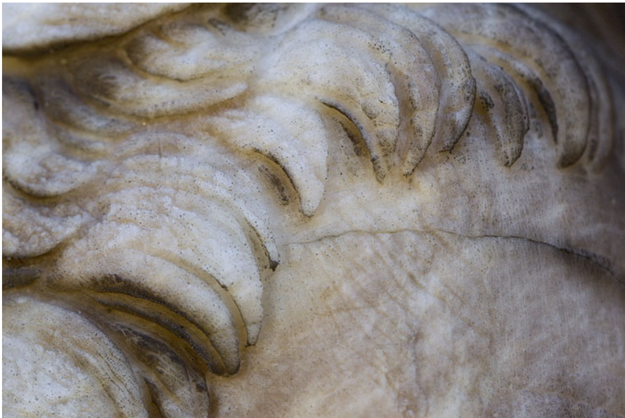
Auguste : détail des cheveux.