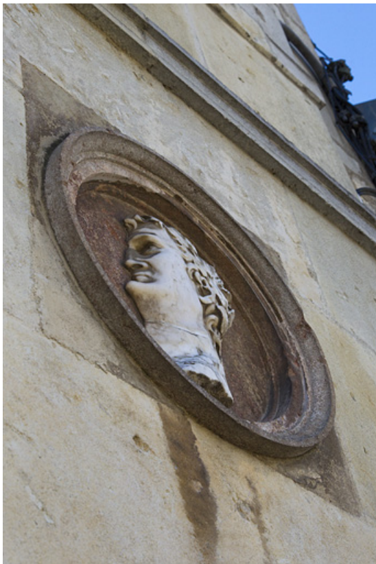
Néron : vue de profil et en contre-plongée.