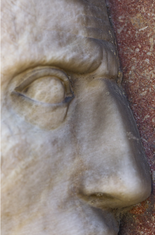
Auguste : détail du nez et de l'oeil.