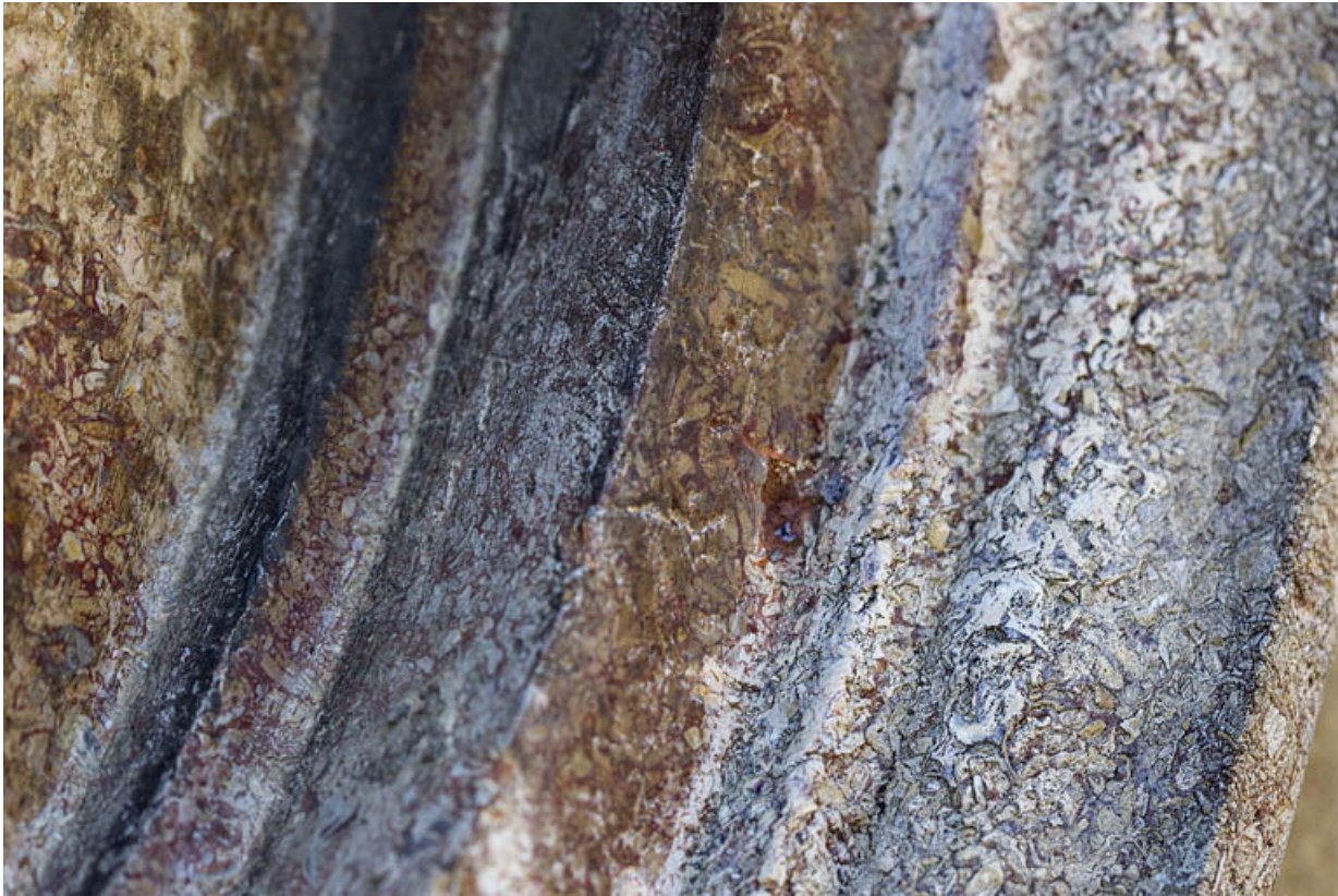
Néron : détail de la moulure du médaillon.