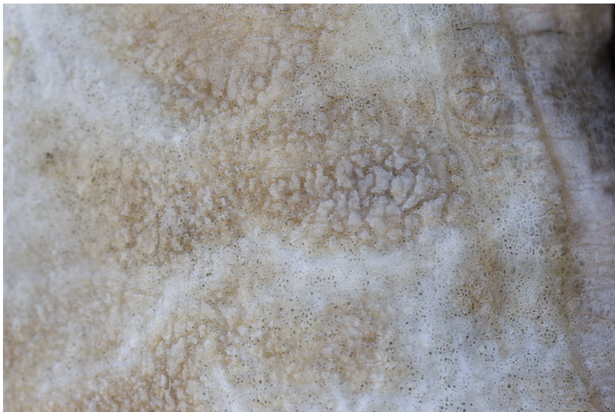
Auguste : altération de l'albâtre.