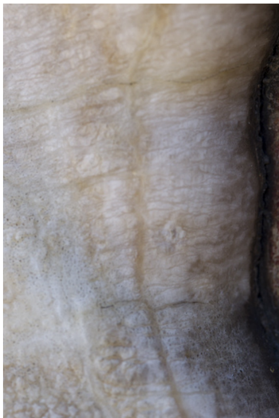
Auguste : altération de l'albâtre au niveau du cou.