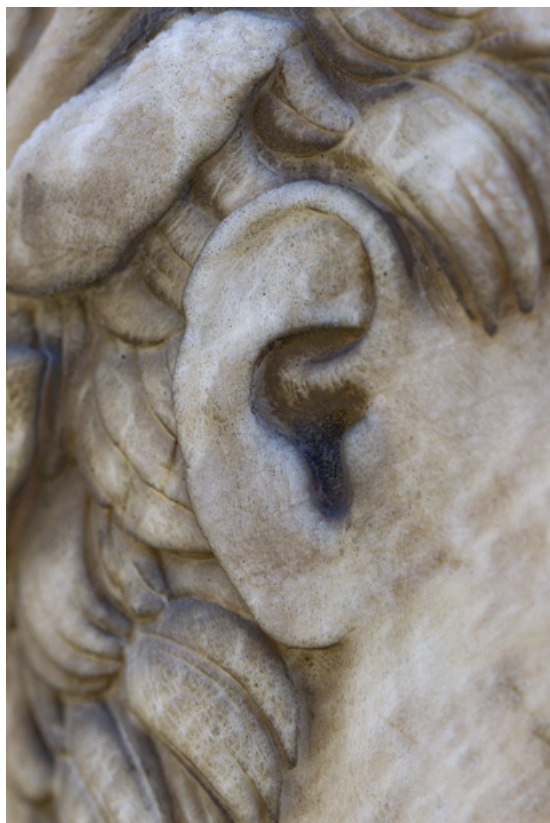
Auguste : détail de l'oreille.