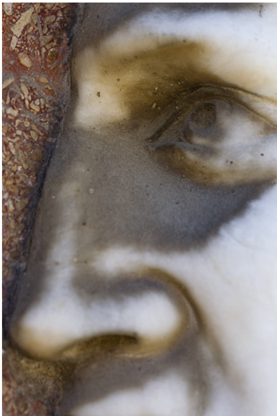
Néron : détail du nez et de l'oeil.