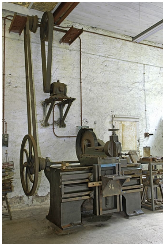
Vue d'ensemble de trois quarts gauche.

70, Corravillers R.D. 6, lieudit : Champs Fauvey