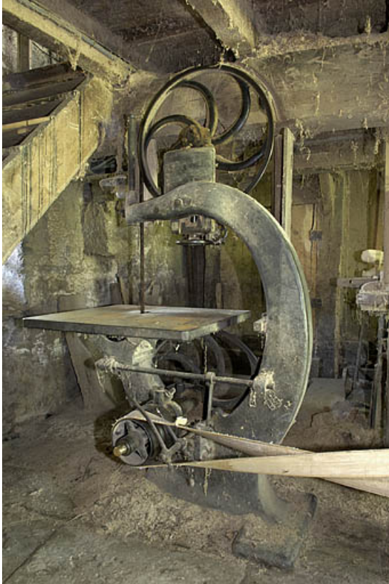
Rez-de-chaussée. Scie à ruban J. Guilliet - Egré et Cie.

70, Sainte-Marie-en-Chanois, lieudit : sur le Breuchin