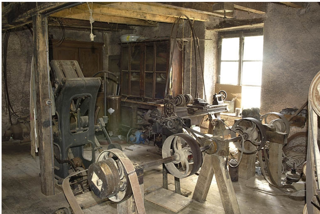
Premier étage. Vue de l'atelier depuis l'ouest. Au premier plan : banc d'affûtage. 70, Sainte-Marie-en-Chanois, lieudit : sur le Breuchin