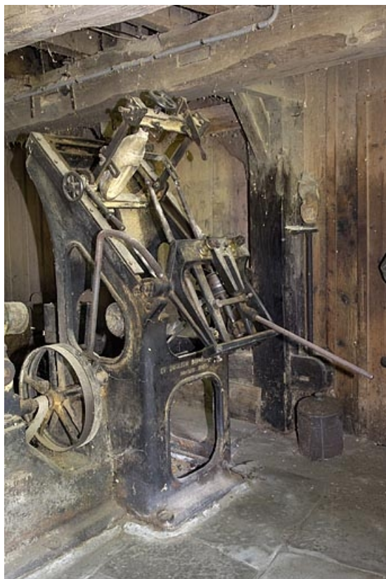
Rez-de-chaussée. Tour à cuillères (videuse) Bonneau & Schwartz et Cie.

70, Sainte-Marie-en-Chanois, lieudit : sur le Breuchin