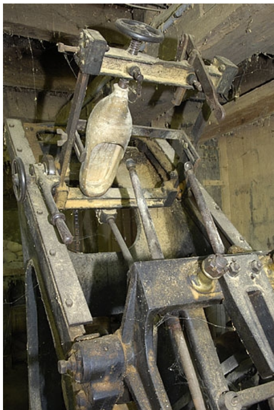
Rez-de-chaussée. Tour à cuillères (videuse) Bonneau & Schwartz et Cie. Détail de la partie supérieure. 70, Sainte-Marie-en-Chanois, lieudit : sur le Breuchin