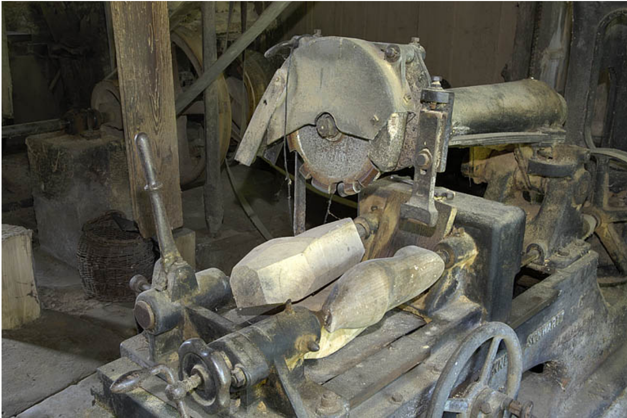
Rez-de-chaussée. Tour à reproduire Bonneau & Schwartz et Cie.

70, Sainte-Marie-en-Chanois, lieudit : sur le Breuchin