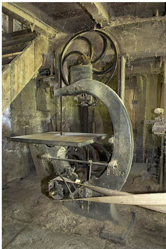
Rez-de-chaussée. Scie à ruban J. Guilliet - Egré et Cie. 70, Sainte-Marie-en-Chanois, lieudit : sur le Breuchin