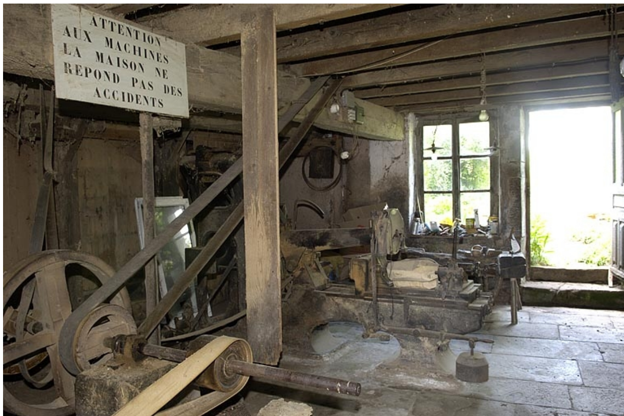
Rez-de-chaussée. Vue d'ensemble depuis l'entrée.

70, Sainte-Marie-en-Chanois, lieudit : sur le Breuchin