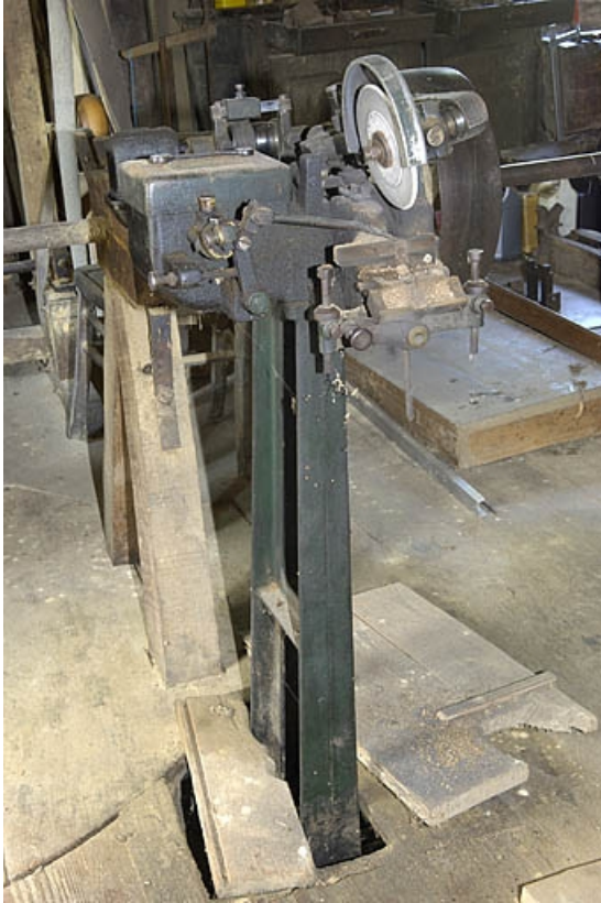
Premier étage. Tour à meuler.

70, Sainte-Marie-en-Chanois, lieudit : sur le Breuchin