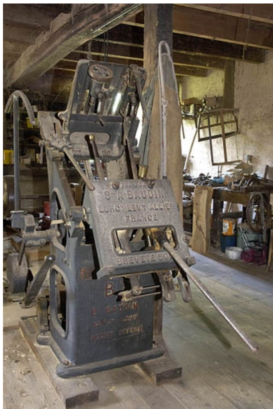
Premier étage. Tour à cuillères (videuse) A. Baudin. 70, Sainte-Marie-en-Chanois, lieudit : sur le Breuchin