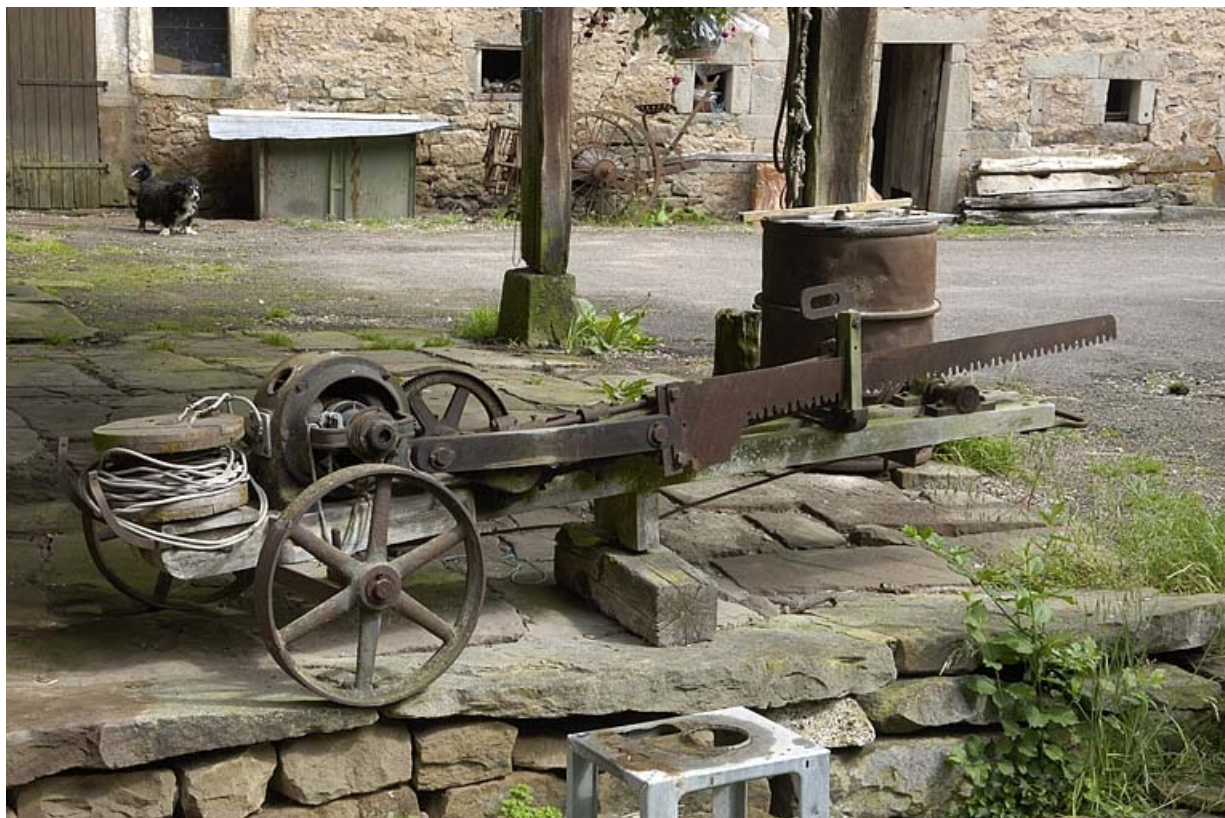
Tronçonneuse artisanale placée sous l'auvent de l'atelier.

70, Sainte-Marie-en-Chanois, lieudit : sur le Breuchin