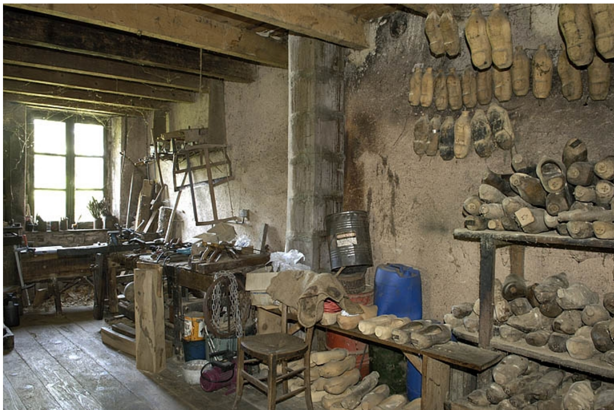
Premier étage. Vue de l'atelier depuis l'est.

70, Sainte-Marie-en-Chanois, lieudit : sur le Breuchin