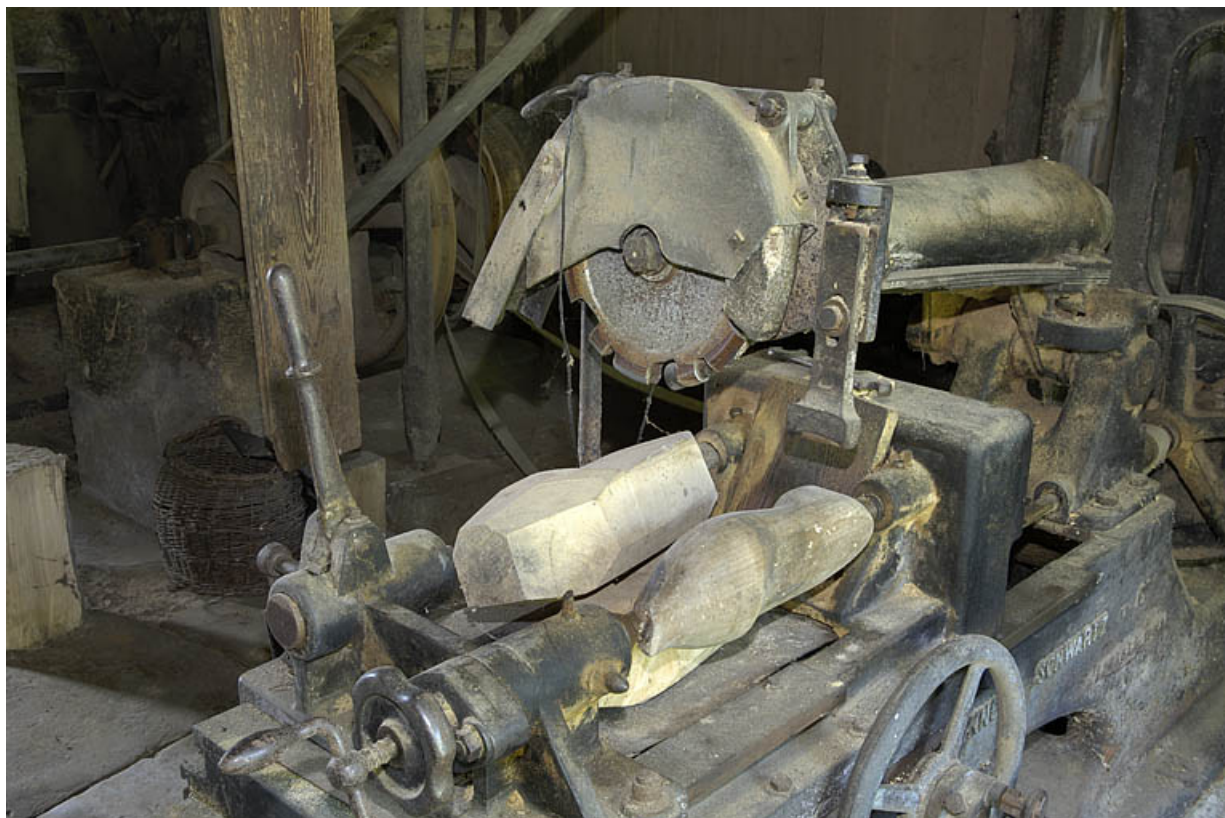
Rez-de-chaussée. Tour à reproduire Bonneau & Schwartz et Cie.

70, Sainte-Marie-en-Chanois, lieudit : sur le Breuchin