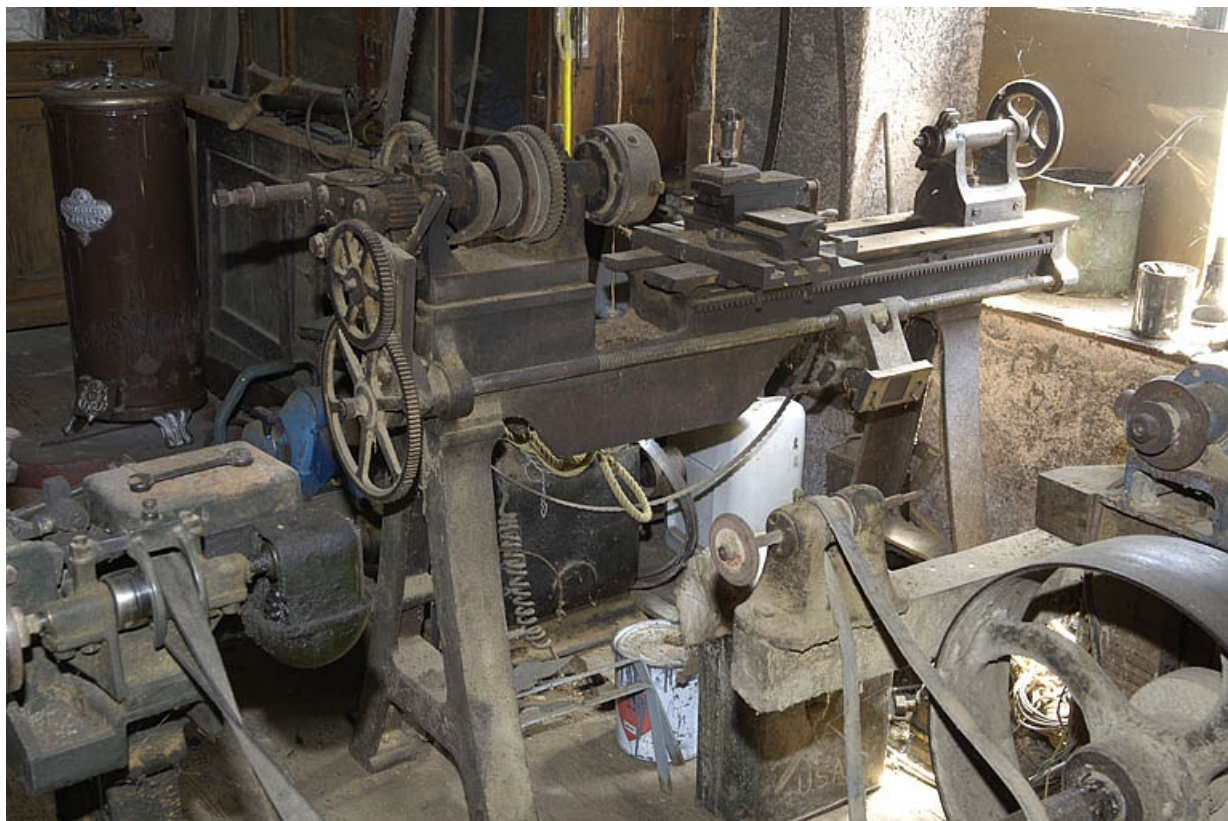
Premier étage. Tour à bois horizontal.

70, Sainte-Marie-en-Chanois, lieudit : sur le Breuchin