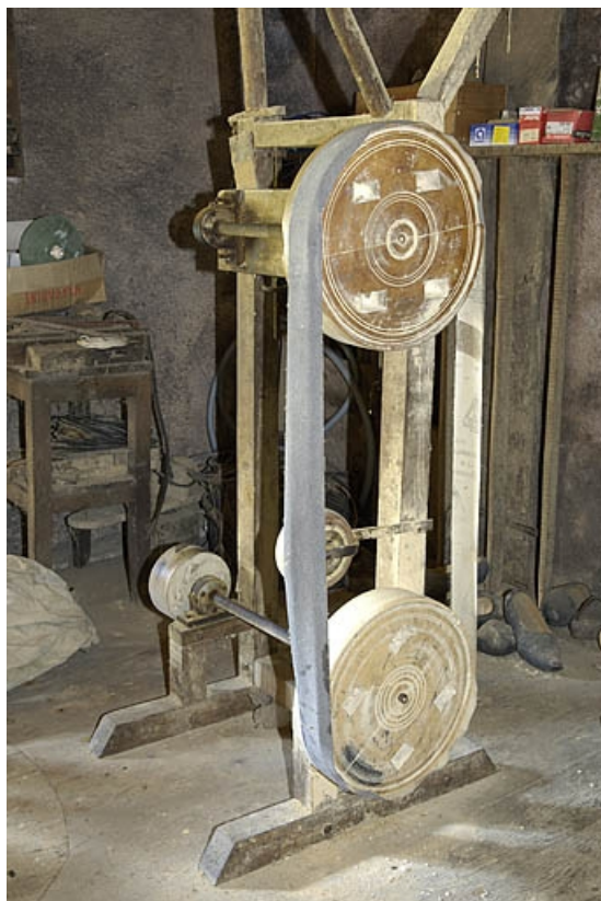
Premier étage. Polissoir à bande.

70, Sainte-Marie-en-Chanois, lieudit : sur le Breuchin