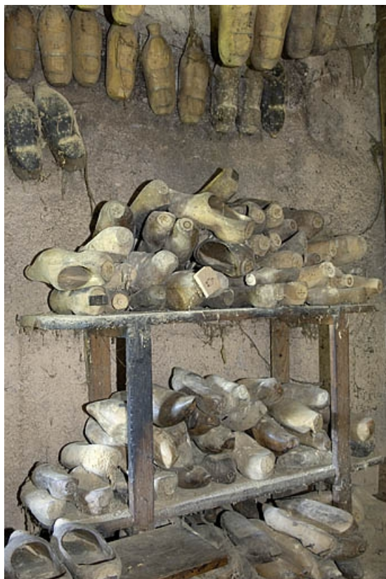
Premier étage. Stock de sabots inachevés.

70, Sainte-Marie-en-Chanois, lieudit : sur le Breuchin