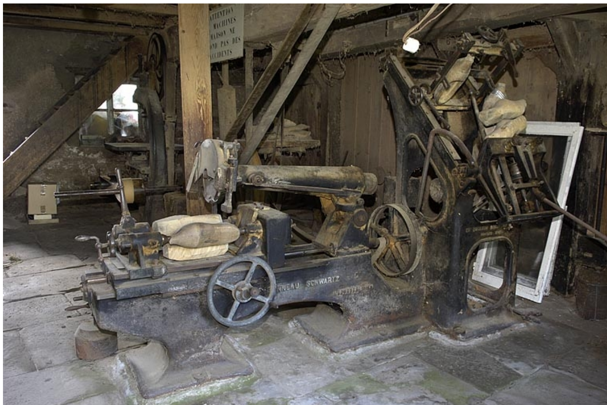
Rez-de-chaussée. Vue d'ensemble depuis l'ouest.

70, Sainte-Marie-en-Chanois, lieudit : sur le Breuchin