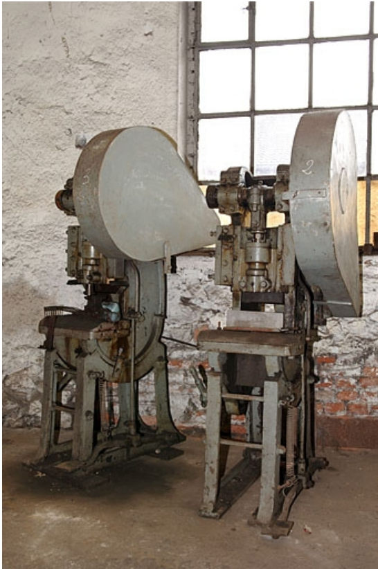
Vue de trois quarts.

70, Corravillers R.D. 6, lieudit : Champs Fauvey