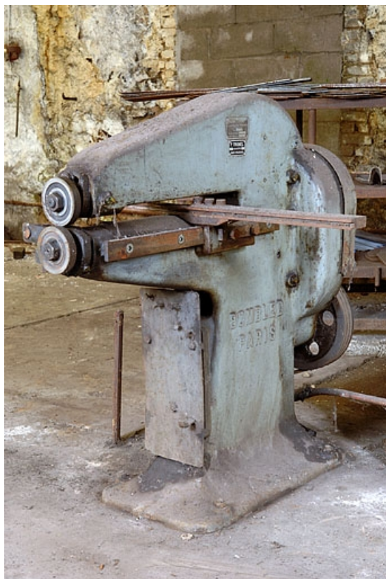
Vue de trois quarts.