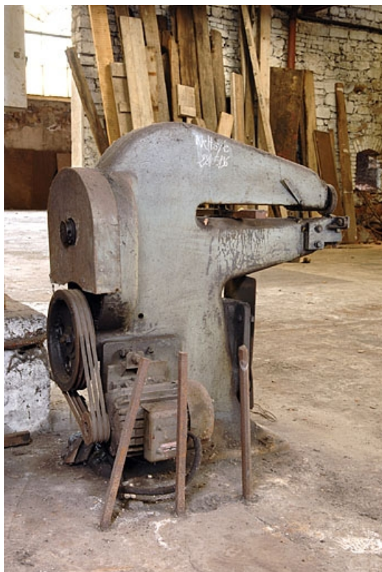
Vue de trois quarts arrière.