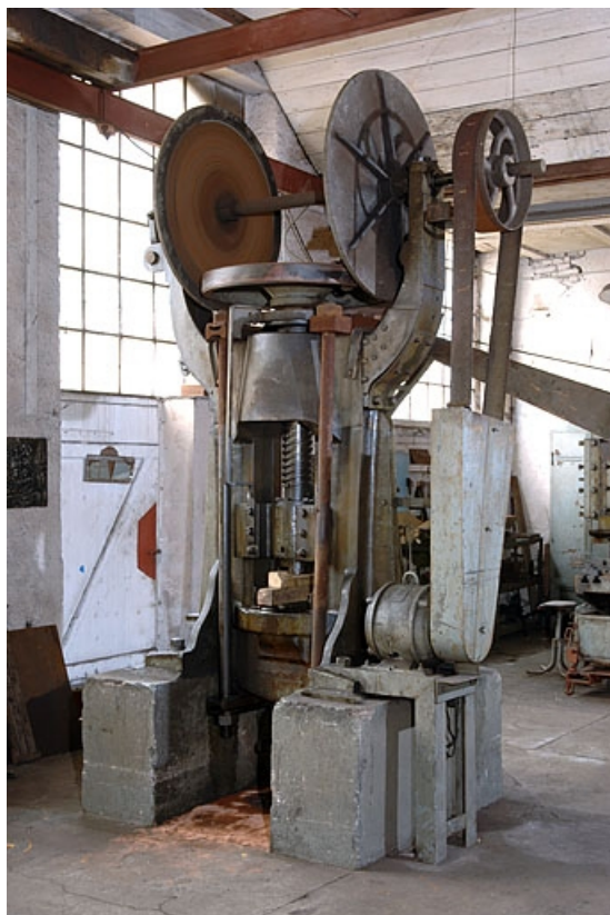
Vue de trois quarts arrière.

70, Corravillers R.D. 6, lieudit : Champs Fauvey