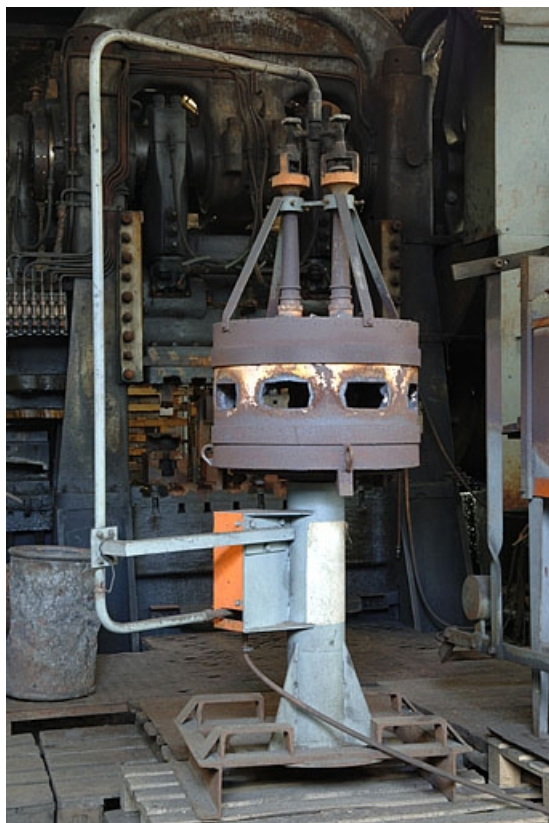
Vue arrière d'un four.

70, Corravillers R.D. 6, lieudit : Champs Fauvey