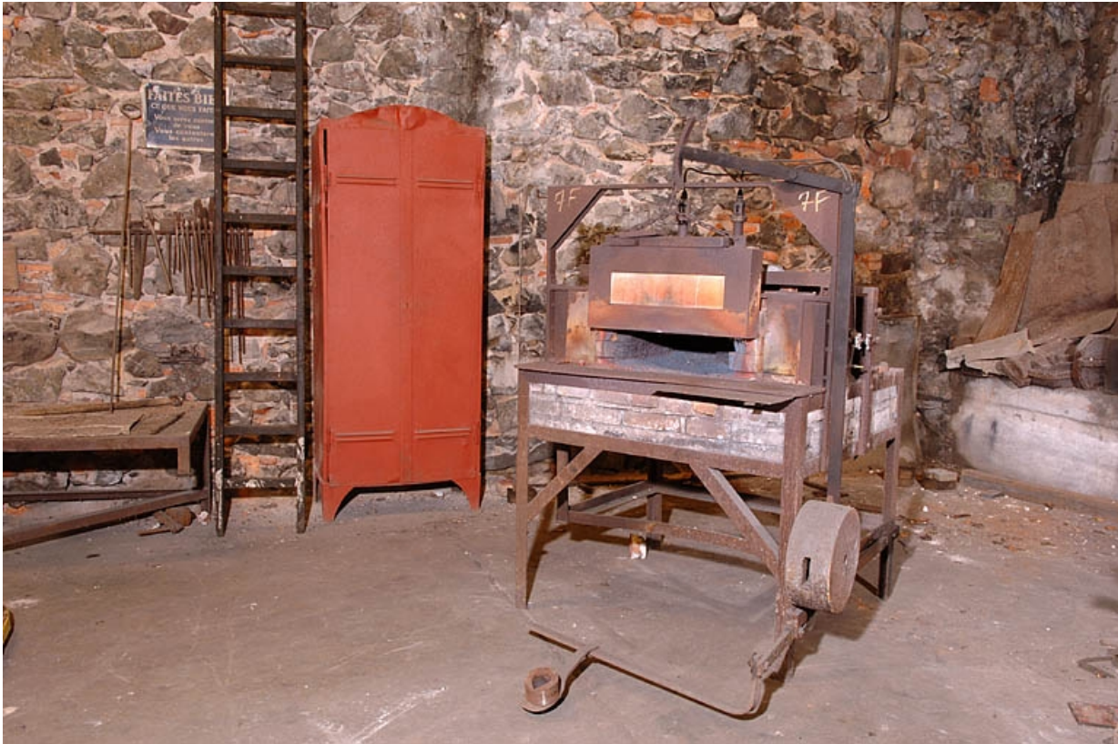
Four de plan rectangulaire (lettre D sur le plan de localisation).