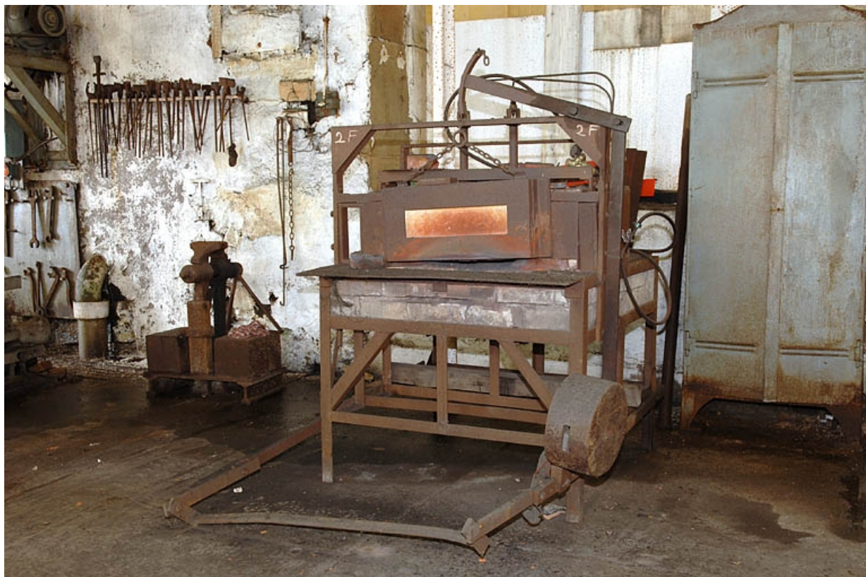
Four de plan rectangulaire (lettre B sur le plan de localisation).