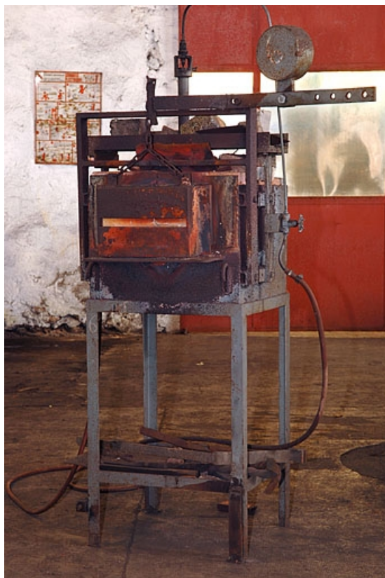
Four de plan carré (lettre A sur le plan de localisation).