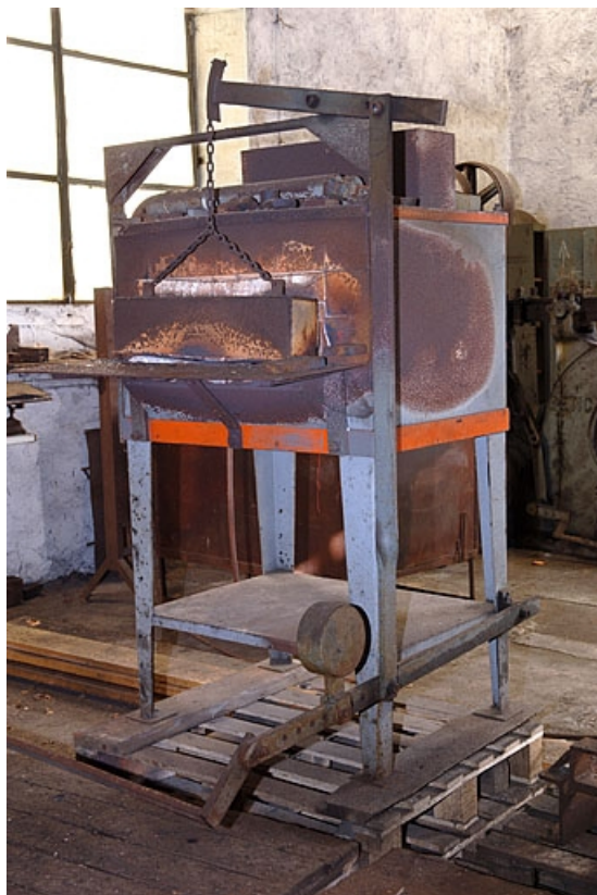
Vue de trois quarts d'un four à manomètre (lettre F sur le plan de localisation).