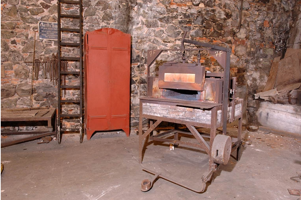
Four de plan rectangulaire (lettre D sur le plan de localisation).