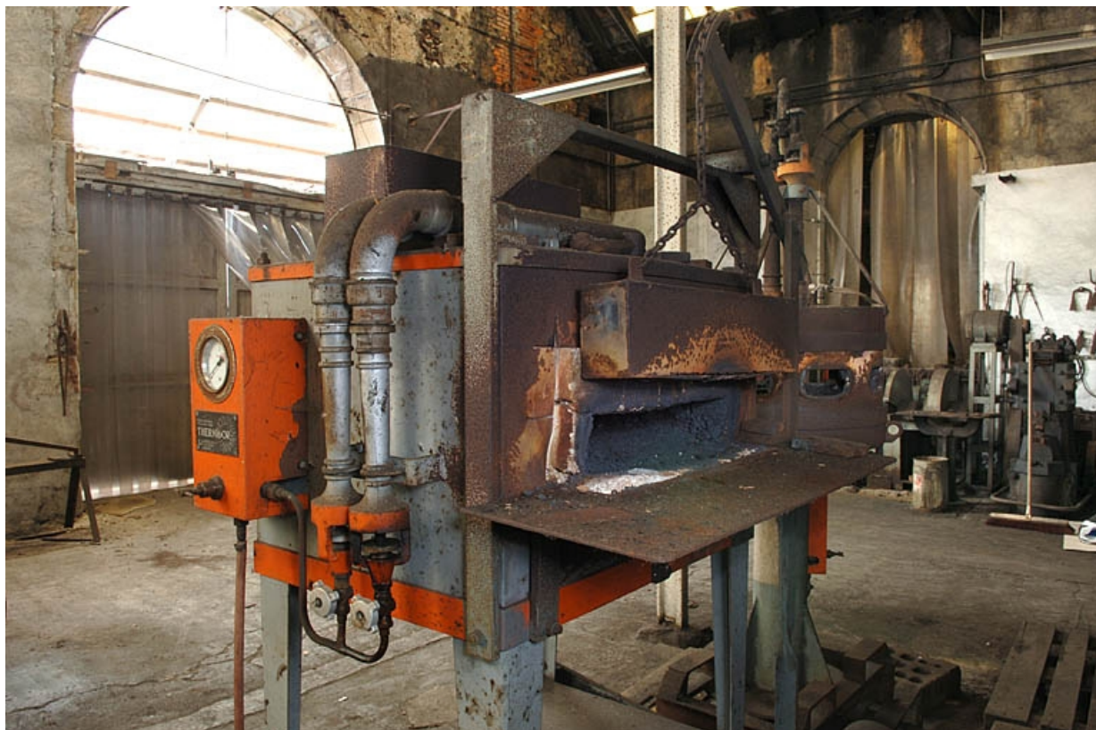
Four à manomètre en position ouverte (lettre F sur le plan de localisation).