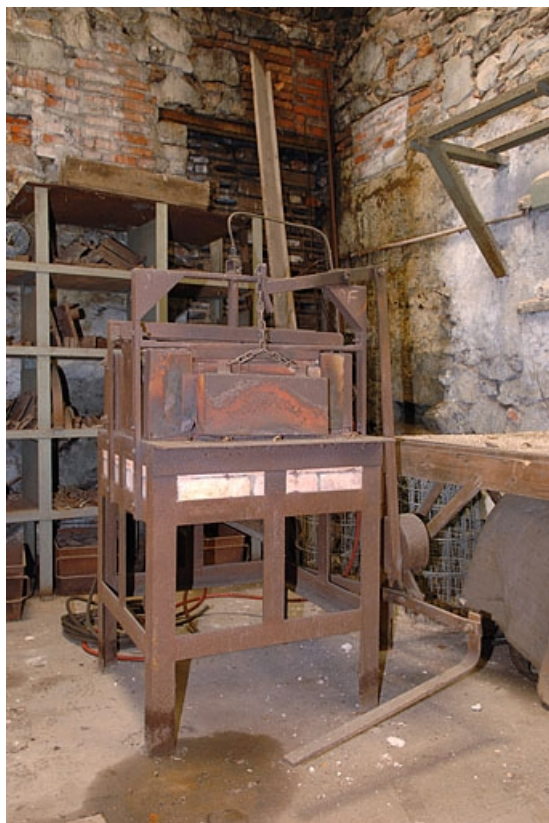
Four de plan rectangulaire (lettre C sur le plan de localisation).