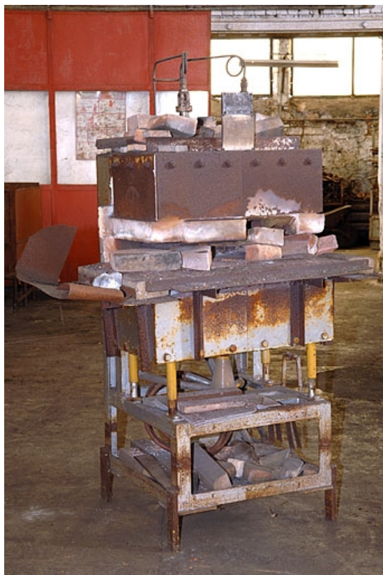
Four de plan rectangulaire (lettre E sur le plan de localisation).