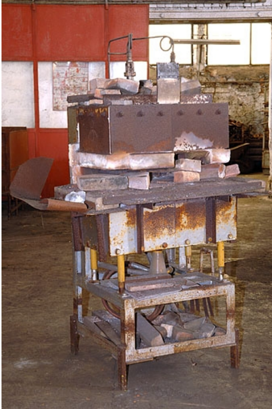
Four de plan rectangulaire (lettre E sur le plan de localisation).