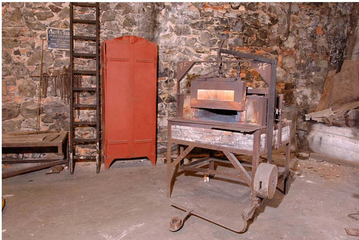
Four de plan rectangulaire (lettre D sur le plan de localisation).