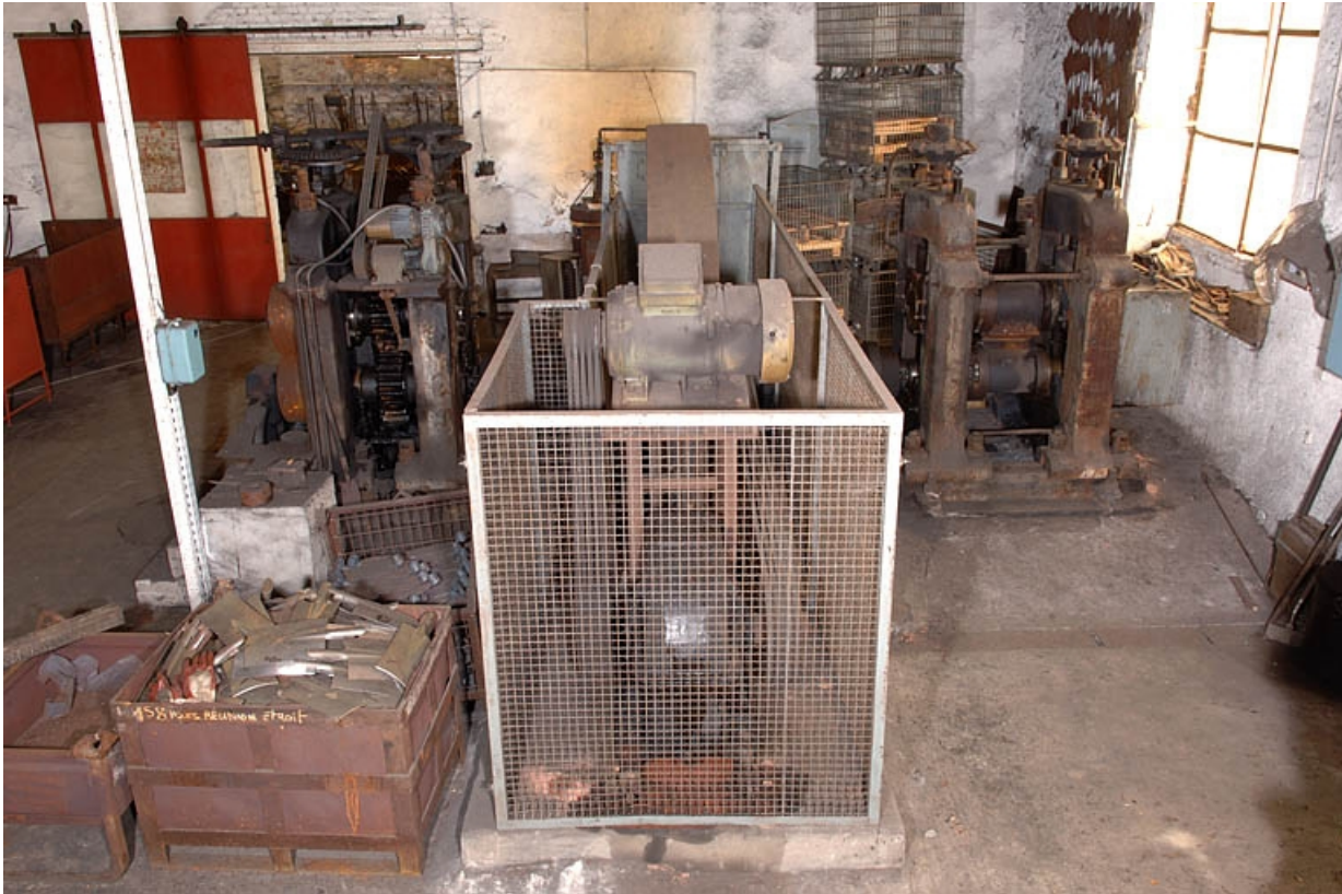
Vue plongeante depuis l'arrière.

70, Corravillers R.D. 6, lieudit : Champs Fauvey