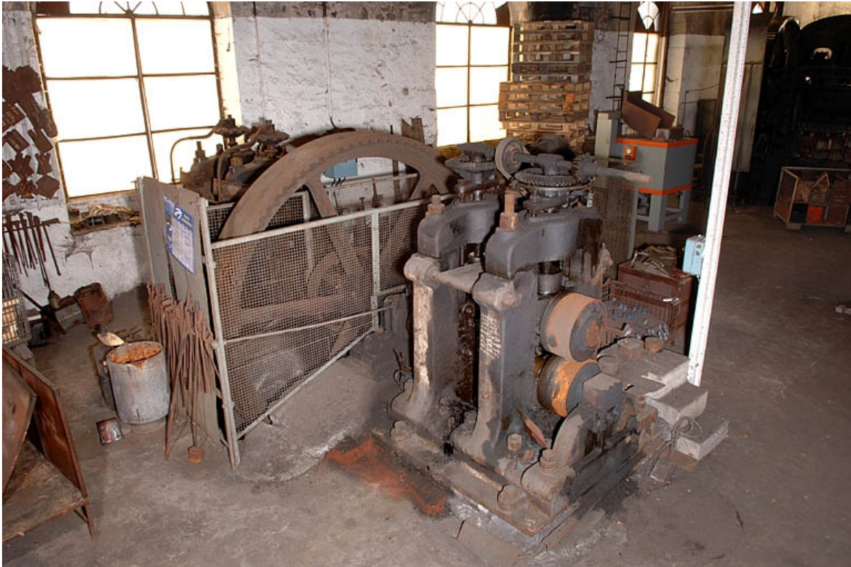
Vue plongeante depuis l'ouest.

70, Corravillers R.D. 6, lieudit : Champs Fauvey