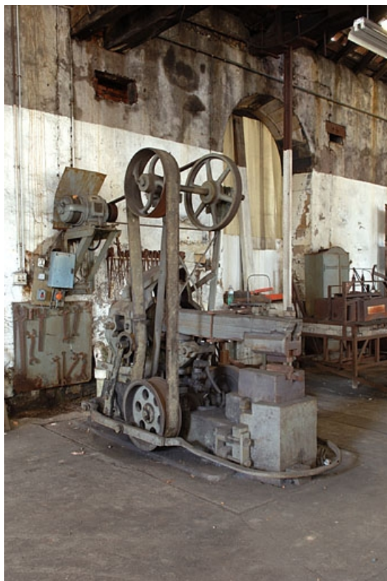
Vue d'ensemble de trois quarts gauche.

70, Corravillers R.D. 6, lieudit : Champs Fauvey